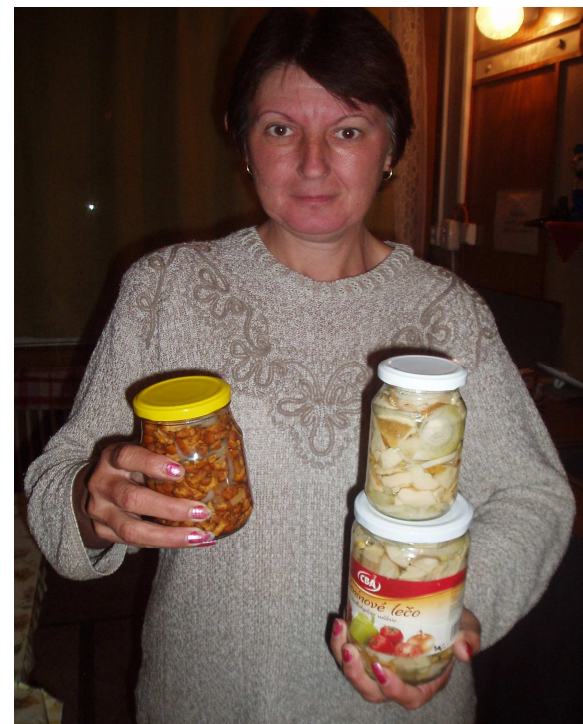
p. Číž pri zaváraní