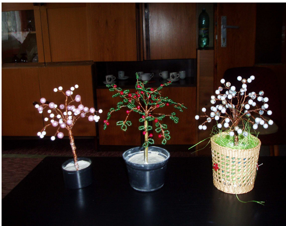
Výsledky usilovnej práce