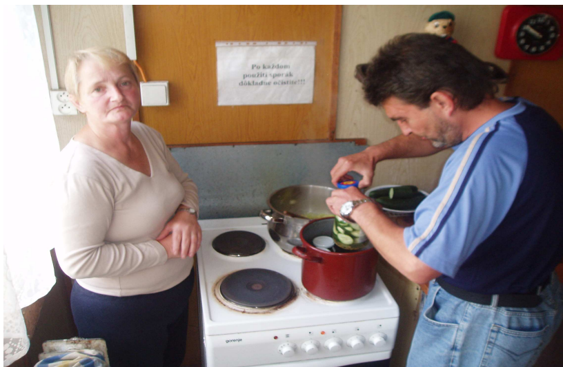
p. Číž so svojimi pochúťkami