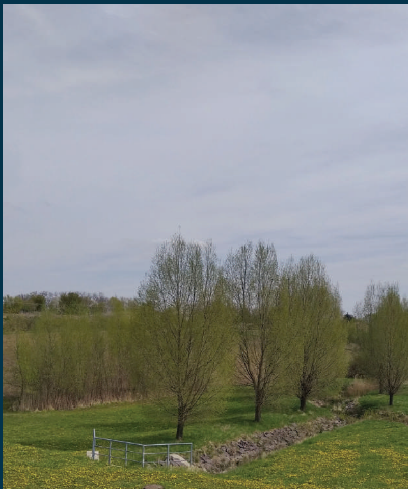
Mokrý nádrž Prušánky