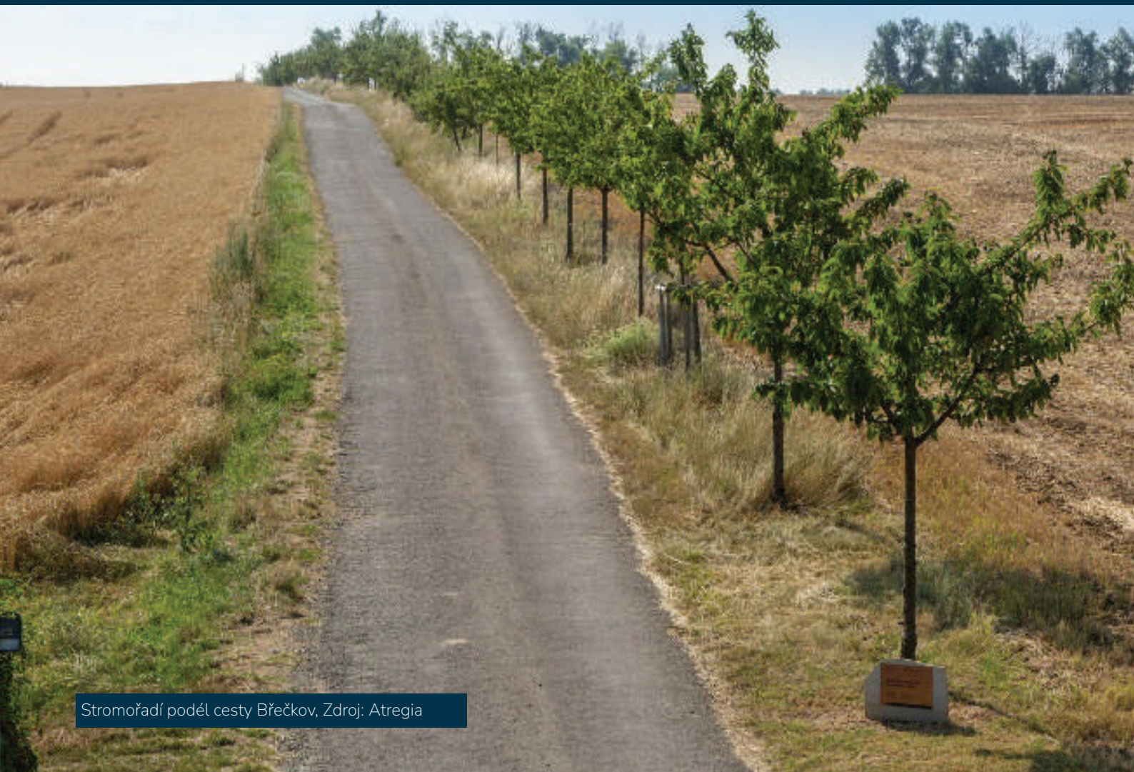
Stromořadí podél cesty Břečkov

Většina původních cest nyní přetíná obrovské lány, obnovením těchto cest se tak vytvoří zelené pásy, které výrazně zpřístupní okolní krajinu.