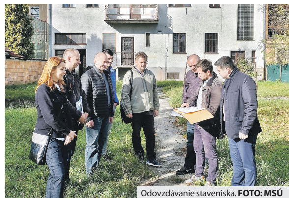
Odvodzovanie staveniska.

„Veľmi sa teším, že sme začali s výstavbou, aj keď trochu neskôr, ako sme predpokladali, no čakali sme na schválenie finančných prostriedkov zo Štátneho fondu rozvoja bývania. Som veľmi rád, že takúto službu bude mesto môcť poskytovať svojim obyvateľom, pretože poradovník žiadateľov v Domove dôchodcov a domove sociálnych služieb Luna je dlhý a vybavenie žiadostí trvá pomerne dlhú dobu. Bohužiaľ, mnohí ľudia sa umiestnenia v tomto zariadení ani nedočkajú. Verím, že našim obyvateľom v oblasti sociálnych služieb opäť vyjdeme v ústrety a že novopostavené zariadenie bude domovom pre mnohých ľudí, ktorí ho potrebujú,“ uzavrel primátor. (md)