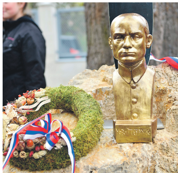
Busta generála Štefánika pri EBG.