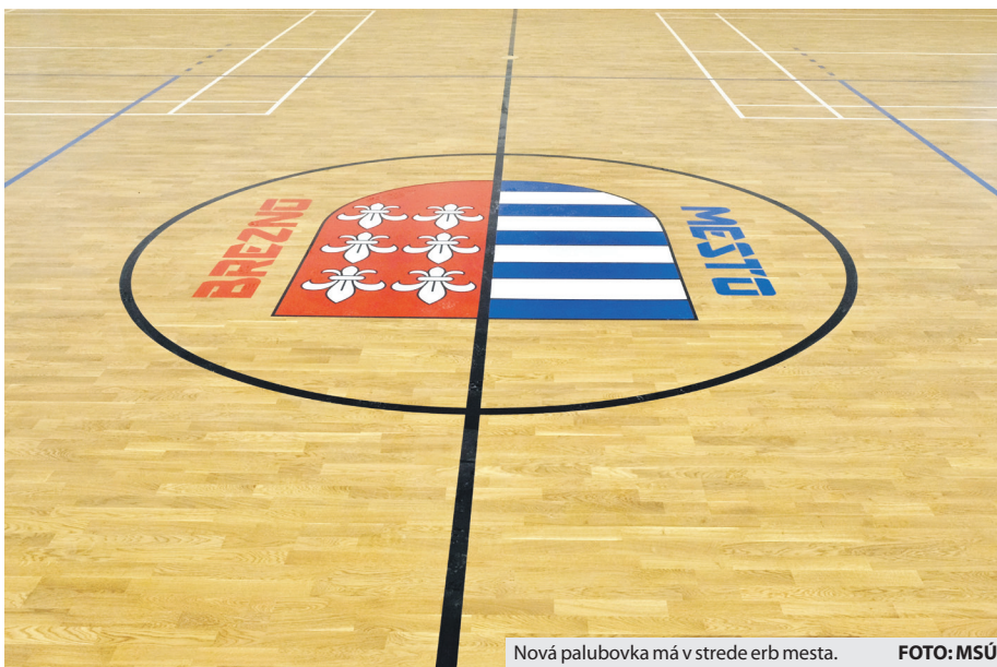
Nová palubovka má v strede erb mesta.

Prevzatie veľkej športovej haly bolo verejnosťou od začiatku vnímané veľmi pozitívne, nakoľko by pre viacero miestnych športových klubov predstavovala riešenie chýbajúceho priestorového zázemia. Keďže ale dlhší čas chátrala, najskôr musela prejsť telocvičňa komplexnou rekonštrukciou. S prácami sa tento rok začalo približne v polovici júna a počas nasledujúcich piatich mesiacov sa v telocvični i jej okolí vôbec nezaháľalo. Na vonkajšej časti budovy pracovníci napríklad zateplili stavbu zo strany viditeľnej od prístupovej cesty. Neskôr vykonali tiež náter vonkajších oporných stĺpov. V interiéri budovy už prebehla komplet-