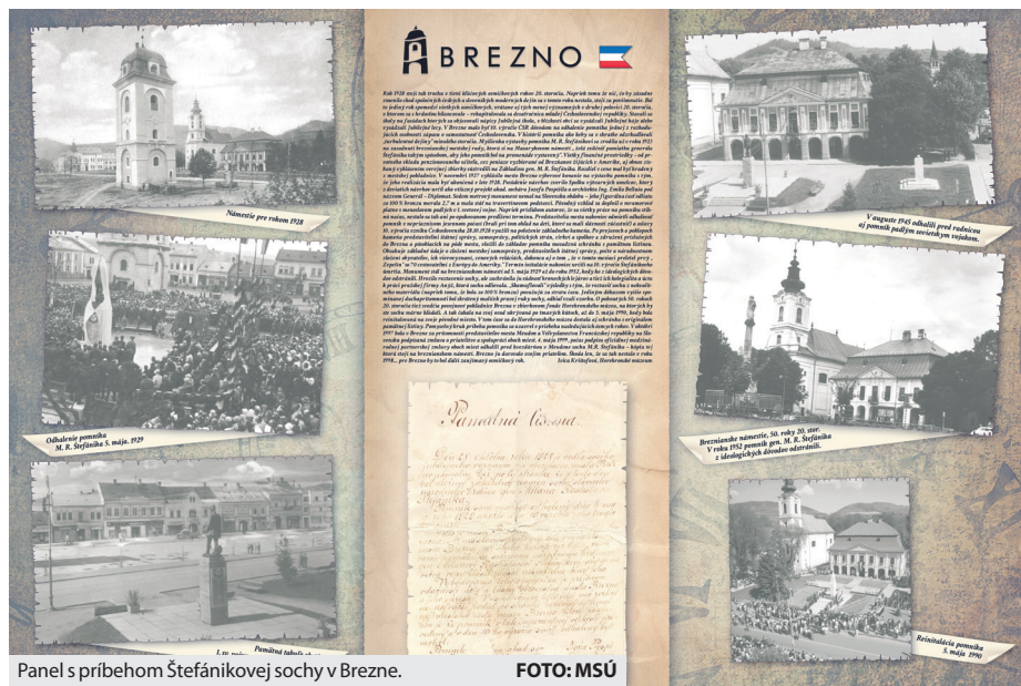
Panel s príbehom Štefánikovej sochy v Brezne.