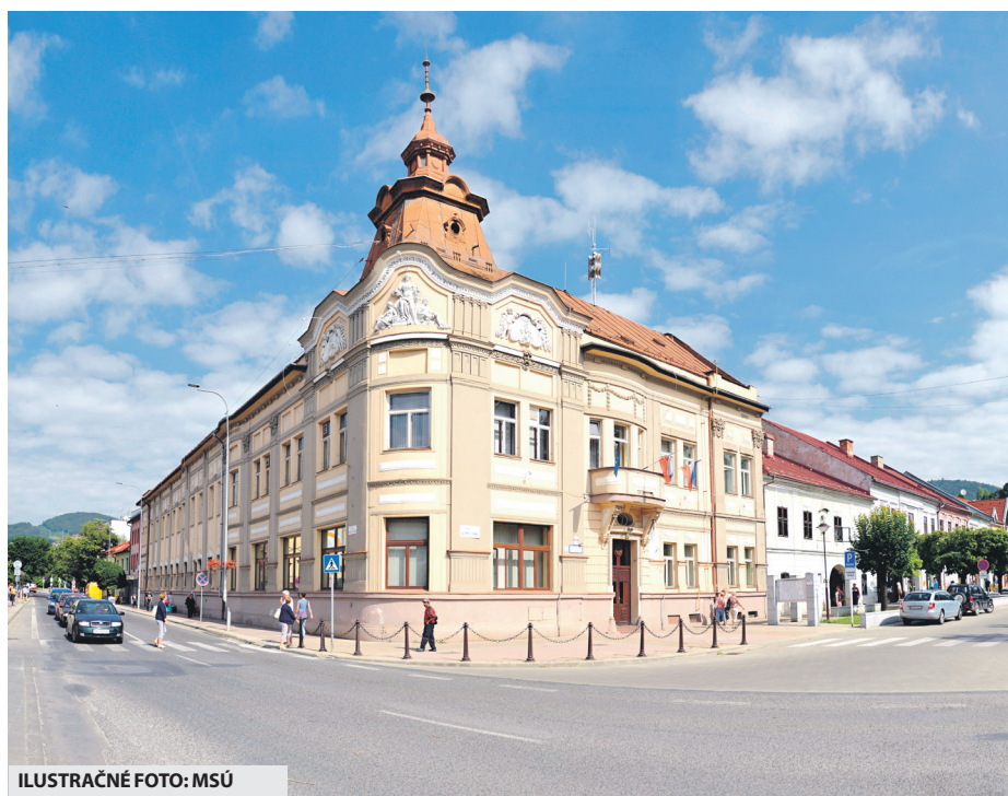
ILUSTRACNÉ FOTO: MSÚ