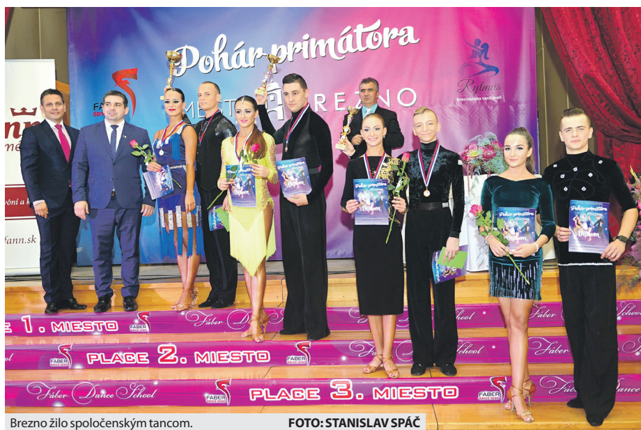
Brezno žilo spoločenským tancom.