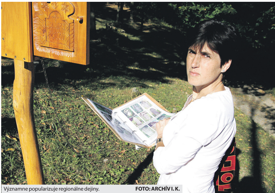
Významne popularizuje regionálne dejiny.

- Myslím, že každého poteší, keď si všimnú jeho prácu a nejakým spôsobom ju ocenia. Som síce za ňu platená, ale nemalo by význam, aby výsledky a výstupy našej odbornej činnosti zostávali len za múrmi múzea. Musíme ich „vyviezť“ a ponúknuť verejnosti v rôznych primeraných a prístupných formách, aby si aj takýmto spôsobom vytvárala k mestu Brezno vzťah. Veď história je predsa učiteľkou života. (eš)