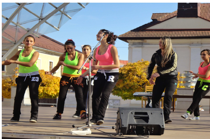
- vystúpenie tanečného krúžku z KC Plamienok