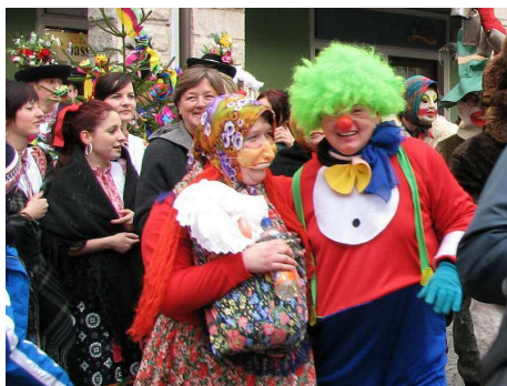
Medzi tradičné fašiangové jedlá patria: papúšky, fánky, klobásy, šišky

Fašiangy predstavujú obdobie od Troch kráľov do Popolcovej stredy. Magicko-prosperitné úkony, charakteristické pre fašiangové obdobie mali blahodárne pôsobiť na čakávanú dobrú úrodu. Fašiangy boli časom priadok, zakáľčiek, svadieb, ktoré sprevádzali zábavy i fašiangové sprievody masiek. Maskovanie v obradoch a hrách už od najstarších čias spĺňalo magicko-rituálne a neskôr aj spoločenské zábavné funkcie. Samotné masky predstavujú zvykoslavné predmety vyrobené z najrozličnejších, v ľudovom prostredí dostupných materiálov.