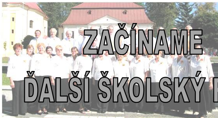
Spevácka Skupina SENIOR