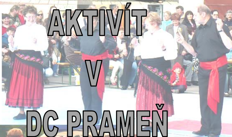
Divadelná Skupina STUDNIČKA