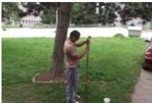
Nezdá sa ale aj p..Kešiel' to s kosou tiež vie.