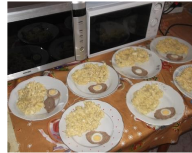
Veľká noc u nás

Šibačka , prútik sa pletie z vrbových či brezových konárov a chlapci ním vyšibú dievčatá, aby boli zdravé, usilovné a veselé po celý rok. Verilo sa, že prútiky dajú dievčatám svoju sviežosť a mladosť. Zdroj: http://www.zaujimave.com/ Dátum: 24.06.2013