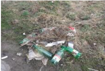
Aj toto ostalo po zime.

Momentky zo života v našom zariadení. Brigáda upratovanie okolia útulku.