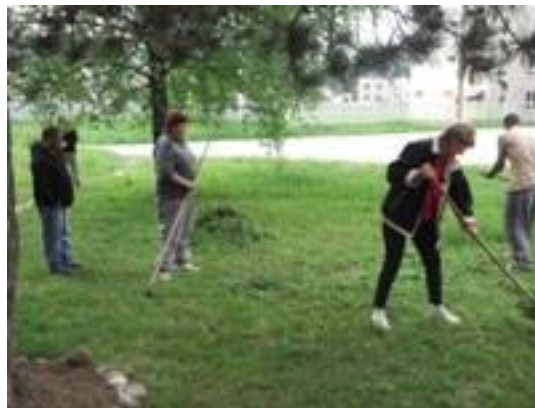
Pekne sme si to podelili, chlapi s kosou a ženy s hrablami.