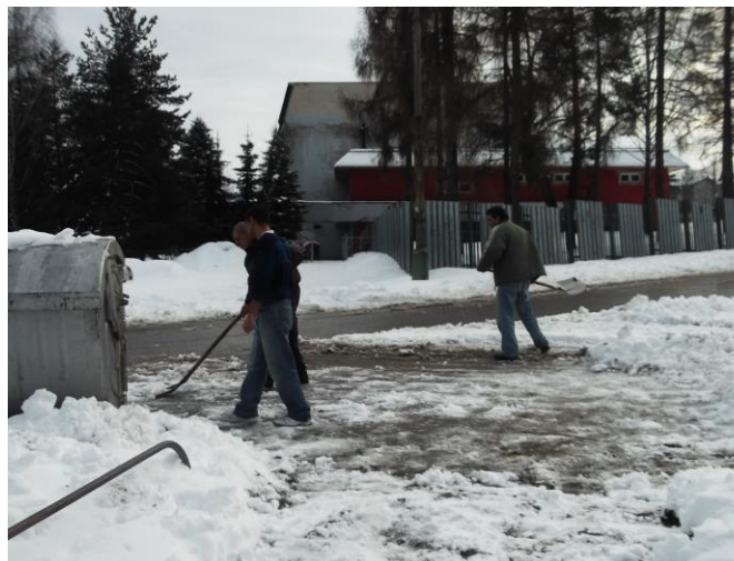
Ešte koncom apríla to vyzeralo aj takto, zima nie a nie sa vzdať.