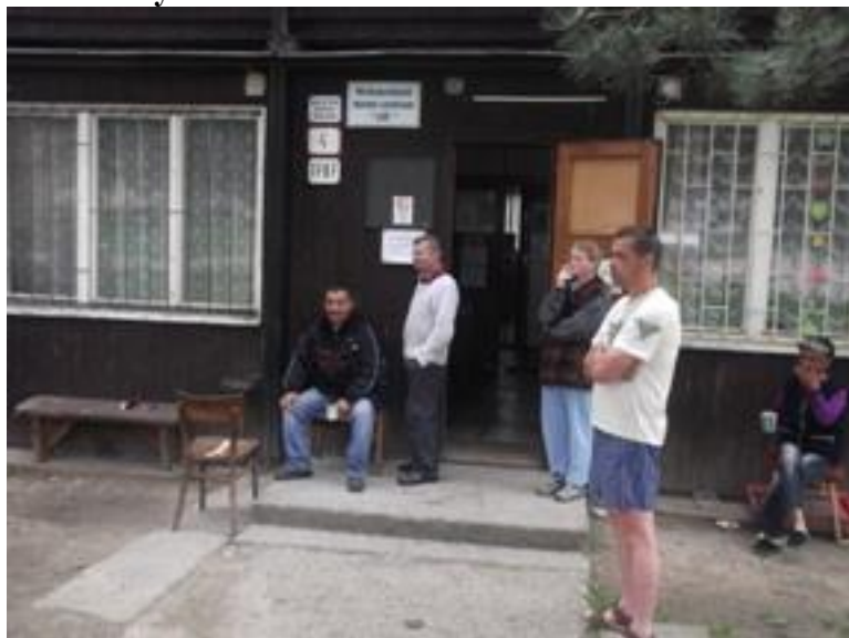
Oddych po práci.