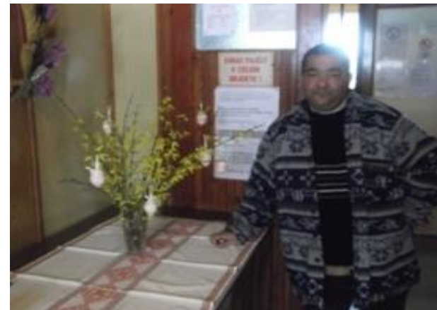
Trošku sme sa okrášlili.