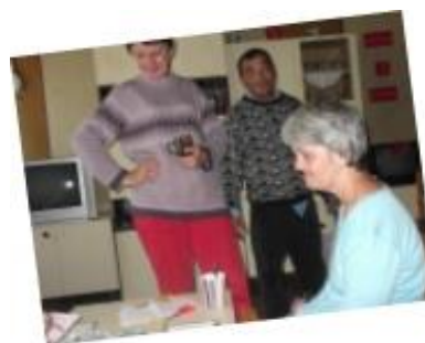
Výroba obrázkov servítkovou metódou.