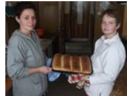
Pre každého niečo pod zub.