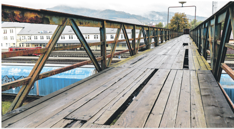
Opravy poškodenej lavice sa mesto napriek splnenej dohode nedočkalo.

Začiatkom septembra sa prevádzkovateľ rozhodol lavicu uzavrieť bez toho, aby na to upozornil mesto. Urobil tak