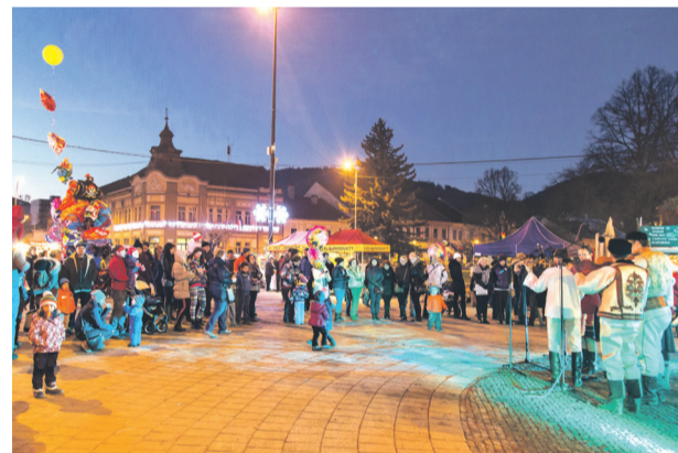
Pravú predsviatocnú atmosféru priniesli do Brezna aj vianočné trhy.