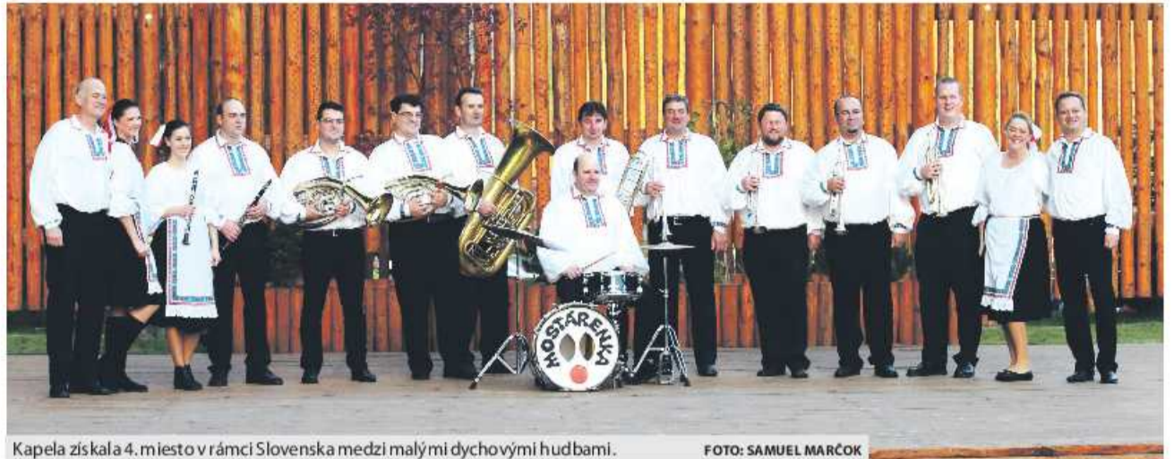
Kapela získala 4. miesto v rámci Slovenska medzi malými dychovými hudbami.