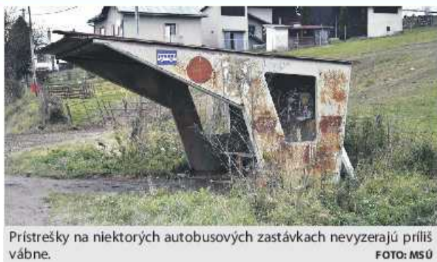
Prístrešky na niektorých autobusových zastávkach nevyzerajú príliš vábne.