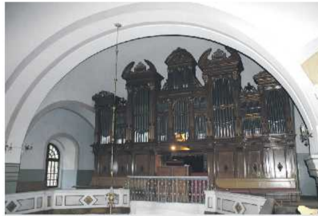
Organ v evanjelickom kostole v Brezne patrí medzi najväčšie na Slovensku.

Na spoločenskom a kultúrnom živote mesta Brezna sa podieľa aj Miestny odbor Maticy slovenskej, ktorý pri príležitosti výročia pripravil kultúrne podujatie od 14.00 v mestskom dome kultúry. Už pri vstupe do sály návštevníkov uvíta výstava o Karolovi Kuzmány. Ako