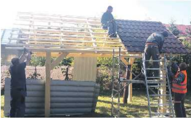
Projekt mesta získal 1300 eur od Nadácie Tesco na úpravu záhrady v Náruči.