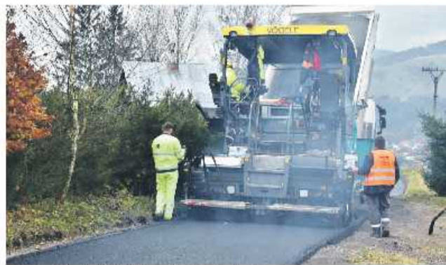
Zničený úsek v Padličkove je už minulosťou.

Mesto Brezno nezabúda ani na mestské časti a snaží sa postupne vyhovieť požiadavkám aj tamojších obyvateľov. Po rokoch, kedy sa údržba mestských ciest a chodníkov zanedbávala, aj táto oblasť patrí medzi priority. Zničený úsek cesty na Padličkove, časti Bujakovo, je už od stredy 2. novembra minulosťou a občania jazdia po novom „koberci“. Oprave miestnej komunikácie a samotnému asfaltovaniu, ktoré realizovali Cestné stavby Liptovský Mikuláš, predchádzali práce technických služieb. „Urobili sme komplex-