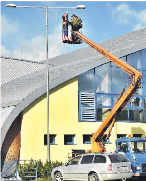
Nové lampy osvetľujú už chodník smerom k hypermarketu Tesco.

Novootvorená záhrada bude slúžiť na organizovanie kultúrno-spoločenských, športových a vzdelávacích aktivít pre konkrétne cieľové skupiny. Ľudia budú mať priestor nielen na to, aby sa niečo nové naučili, ale aby sa mohli navzájom stretávať, spoznávať, vymieňať si skúsenosti a vzájomne si pomáhať, čo je v dnešnej dobe internetu a sociálnych sietí mimoriadne dôležité. (jl)