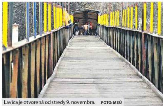
Lavica je otvorená od stredy 9. novembra.

Lavica pre peších bola zatvorená od 2. septembra vlaňajšieho roka, kedy sa ju vtedajší vlastník rozhodol uzavrieť z bezpečnostných dôvodov. Mesto našlo spôsob opätovného spriechodnenia, no pred tým ešte muselo dôjsť k majetkoprávnemu vysporiadaniu lavice a k jej prevodu do vlastníctva mesta. Od konca augusta opravy prebiehali pod taktovkou technických služieb,