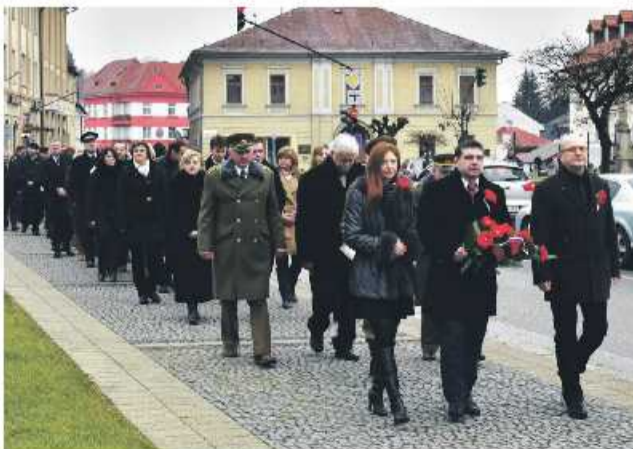
Brezno si pietnym aktom pripomenulo Deň vojnových veteránov.

ocitlo približne 115 miliónov vojakov a 10 miliónov z nich sa, žiaľ, už domov nikdy nevrátilo. Ďalším miliónom navždy zmenila život trvalými následkami vo forme zmrzačenia či psychických problémov. Hoci sa frontové boje dotkli Slovenska len okrajovo, straty na životoch boli značné. Zo slovenských vojakov, ktorí tvorili súčasť rakúsko - uhorskej armády ich padlo takmer 70 000. Pri vtedajšom počte obyvateľov okolo 2 a pol milióna išlo o obrovskú tragédiu. Svedčí o tom aj fakt, že pamätníky pre zahynutých v rokoch 1914-1918 nájdeme snáď v každej