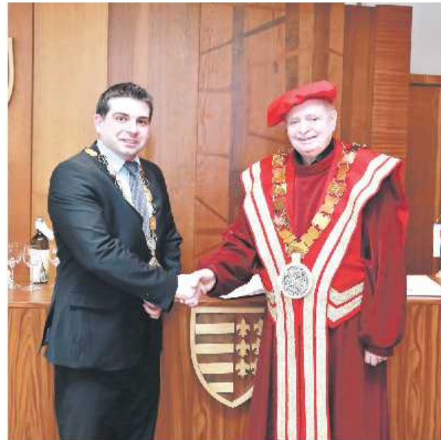
V apríli tohto roka mesto podpísalo Memorandum o spolupráci s banskobystrickou Akadémiou umení.

Hudobné koncerty, výtvarné diela či divadelná a filmová tvorba – na to všetko slúži novozrekonštruovaná historická budova bývalej židovskej synagógy v Brezne. Aby mohla plniť svoju novú funkciu pravidelne, zahájila miestna samospráva dlhodobú aktívnu spoluprácu s umeleckou obcou. V apríli tohto roka podpísala Memorandum o spolupráci s banskobystrickou Akadémiou umení, vďaka ktorému sa má rozšíriť možnosť kultúrneho vyžitia pre oby-