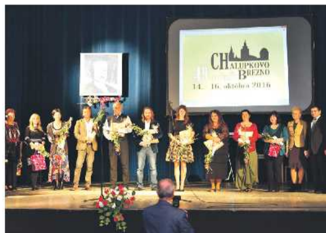
V mestskom dome kultúry slávnostne odovzdali laureátske tituly a ceny na Večere víťazov.