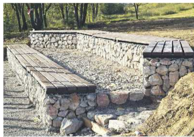
Nové lavičky z dielne technických služieb.