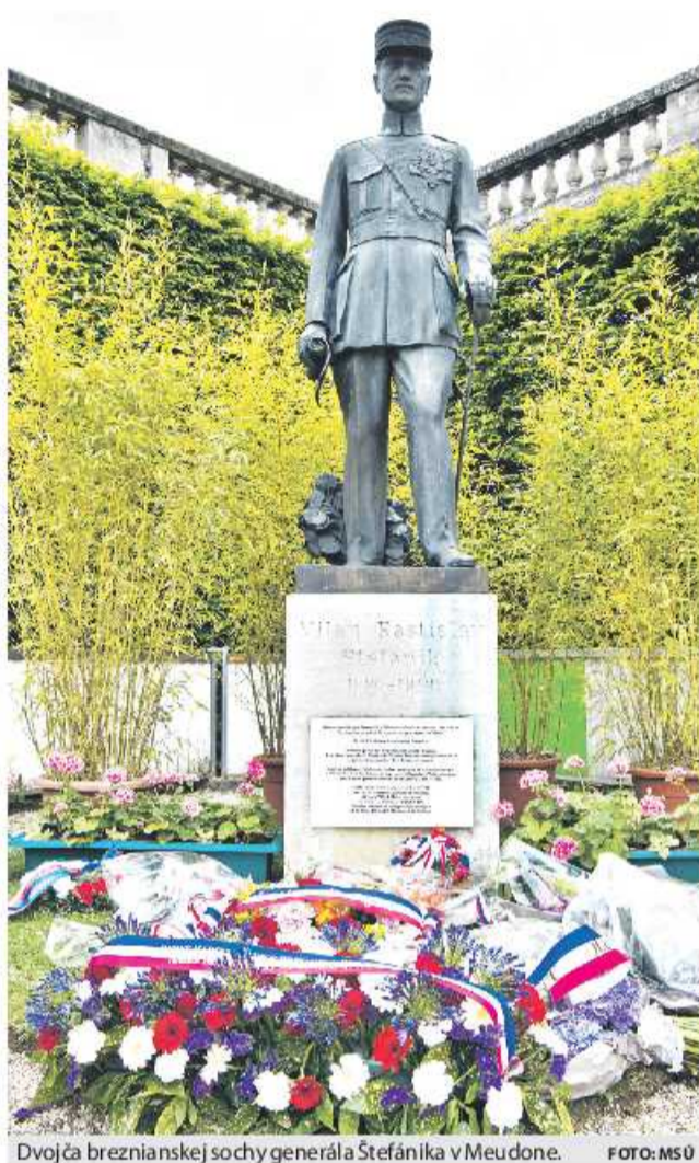
Dvojča breznianskej sochy generála Štefánika v Meudone.