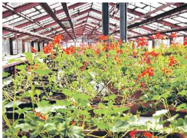
Zamestnanci Technických služieb Brezna zazimovali stovky rastlín.