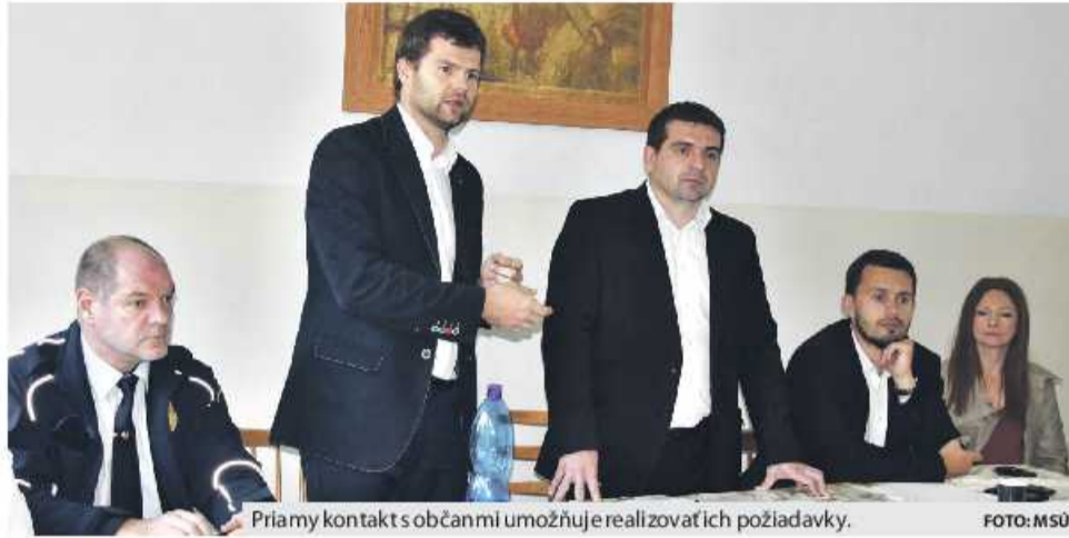
Priamy kontakt s občanmi umožňuje realizovať ich požiadavky.

Stretnutia s občanmi sa už uskutočnili v Podkoreňovej, Zadných Hlnoch, v jedálni ZŠ s MŠ na Mazorníkove, v pohostinstve na starom Mazorníku, v jedálni ZŠ s MŠ Pionierska 2 a v EBG. Rozšírené sú aj o dve nové lokality, a to 24. októbra o 16.30 v Hoteli Rohožná a 26.