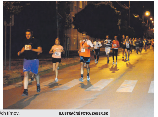
ILUSTRÁČNÉ FOTO: ZABER.SK

ženskej kategórii a tentokrát aj kategórii štvorčlenných tímov, na 7,5-kilometrovej trati s minimálnym prevýšením. Záujem je každoročne veľký, vlni dokon-