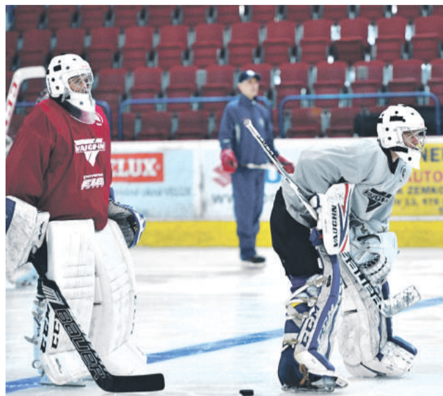
Mladí brankári z celého Slovenska trénujú na breznianskom ľade.

„Máme pripravený program, ktorý má za cieľ všetkým účastníkom našej Školy hokejového brankára uľahčiť vstup do novej sezóny a prispieť k čo najlepšej výkonnos-