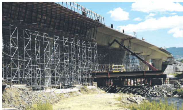
Termín ukončenia výstavby obchvatu sa posúva o 290 dní.

Začiatok užívania prvej etapy obchvatu mesta s dĺžkou 2,54 kilometra sa posunie o niekoľko mesiacov. Ako informovala Lenka Salvianyová zo Slovenskej správy ciest, stavba podľa Zmluvy o diele mala byť ukončená v auguste 2016, no pre zmenu technického riešenia zárubných múrov na Mostárenskej ulici, križovatke Mazorníkovo a ceste II/529, bol aktualizovaný harmonogram, podľa ktorého sa realizujú stavebné práce s predpokladaným ukončením stavby o rok v máji. „Po od-