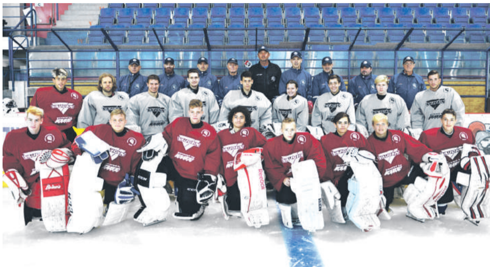
Škola hokejového brankára nabitá trénerskými hviezdami.