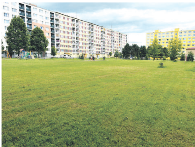
V tejto sezóne sa v celom meste kosilo už trikrát.