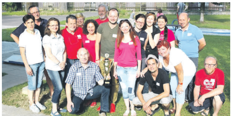
Kultúrni z Brezna sa zišli na neformálnom stretnutí.