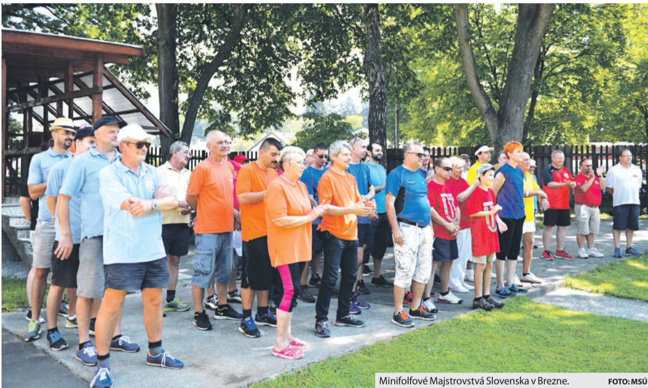
Minifolové Majstrovstvá Slovenska v Brezne.

Brezňania majú po víkende minigolfové majsterky Slovenska v seniorskej aj ženskej kategórii. Chýbajú už len juniorky.