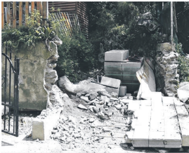
Mesto akýkoľvek pokus o výstavbu nelegálnych príbytkov zruší ešte na jeho začiatku.