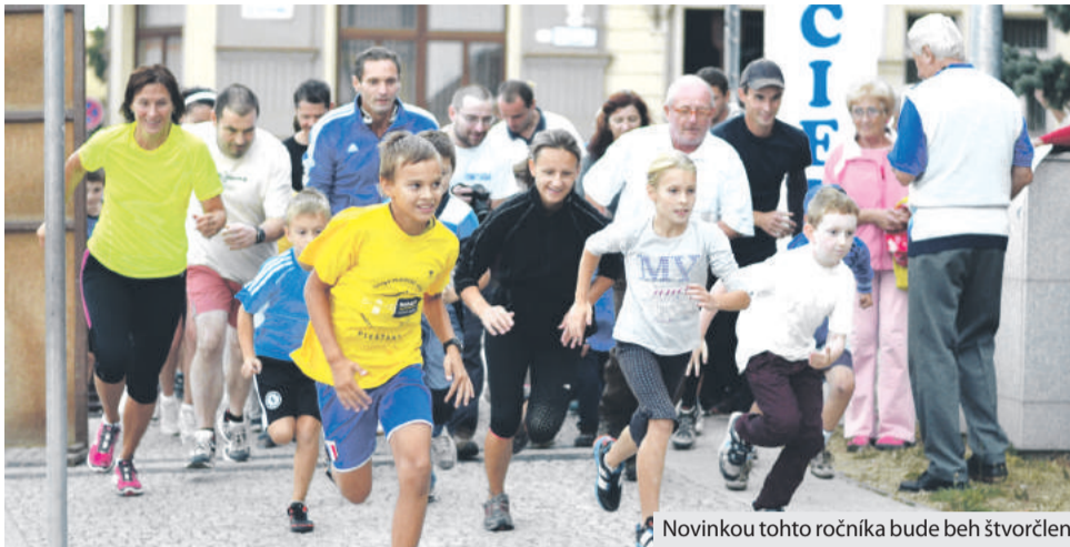
Novinkou tohto ročníka bude beh štvorčlenných tímov.