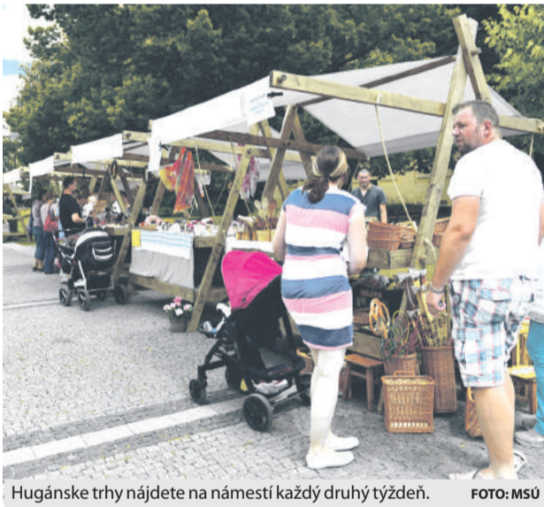
Hugánske trhy nájdete na námestí každý druhý týždeň.