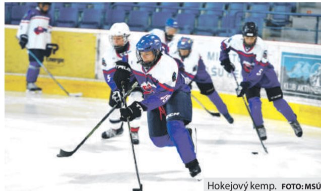
Hokejový kemp.

Keď realizačný tím školy pred tromi rokmi prvýkrát prišiel do Brezna, pozitívne ho prekvapil moderný multifunkčný priestor aj vybavenie mestskej športovej haly. Navyše včasná výroba ľadu je tiež jeden z dôvodov, prečo sa Aréna Brezno stala obľúbeným miestom nielen pre hokejové, ale aj krasokorčuľarske letné kempy či korčuľujúcu verejnosť.