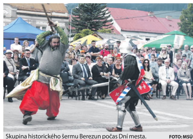
Skupina historického šermu Berezun počas Dní mesta.