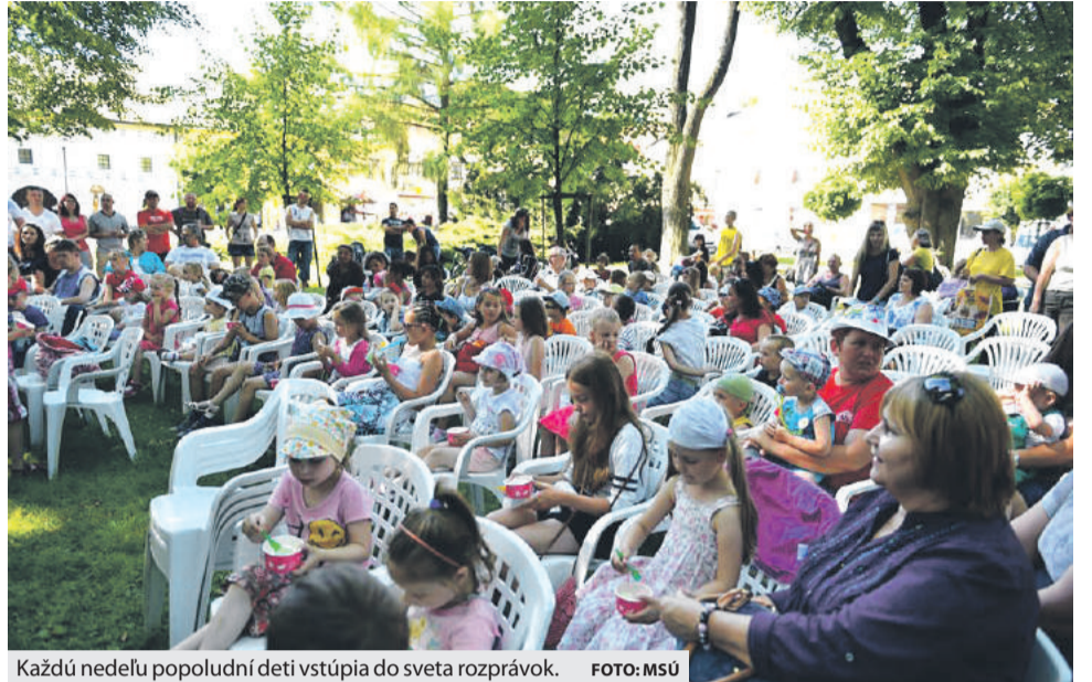
Každú nedeľu popoludní deti vstúpia do sveta rozprávok.