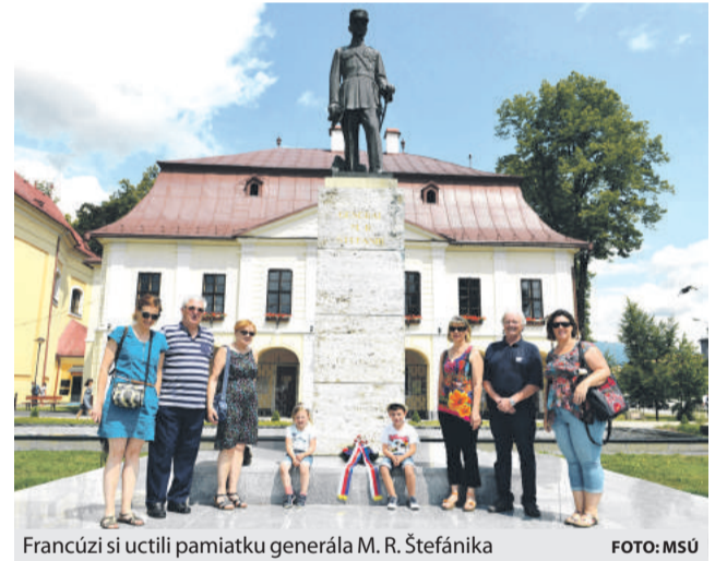
Francúzi si uctili pamiatku generála M. R. Štefánika