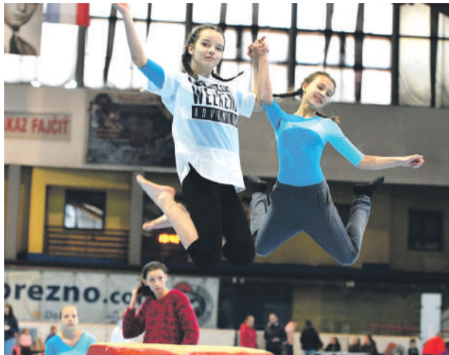
Gymnastky si pre účastníkov podujatia pripravili program.

Štatistiky posledných rokov ukazujú, že ľuďom čoraz viac chýba fyzická aktivita a pohyb ako taký. Výnimkou nie sú ani deti.