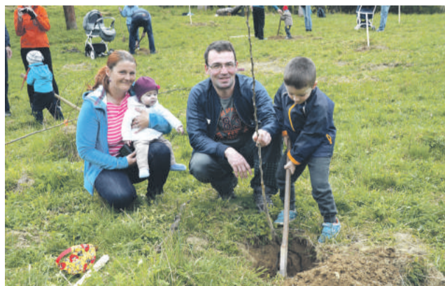
Na Banisku sa konalo už piate sadenie stromčekov pre rodičov s deťmi.