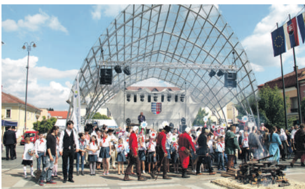
Z minuloročných Dní mesta Brezna.