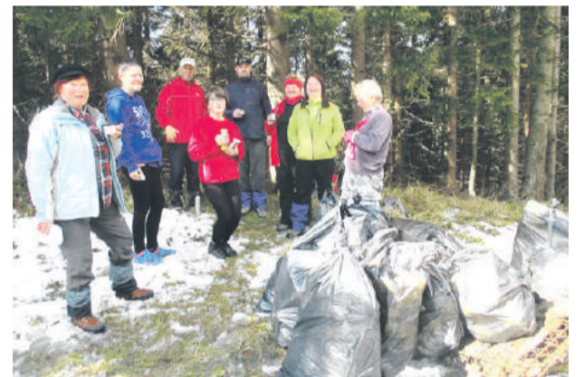
Skupiny turistov, mladých hasičov z Beňuša a pracovníkov Lesov mesta Brezno čistili les. FOTO: E. K.

Nahlasovanie na jednotlivé turnaje na email. adrese: miroslav.baran@brezno.sk . Ďalšie turnaje sa uskutočnia dňa 12.6. a 3.7.2016. Informácie o turnajoch, priebežnom poradí hráčov budú pridávané na mestskej stránke www.brezno.sk v sekcii šport/Aréna Brezno a taktiež na www.stredoslovenski.sk . Hrací deň turnajov je NEDEĽA, pričom prezentácia zúčastnených v dvojhre aj vo štvorhre začína o 8,50 hod., losovanie sa uskutoční o 9,20 hod. a samotný turnaj má začiatok o 9,30 hod. Na každý turnaj je potrebné sa nahlásiť vopred.