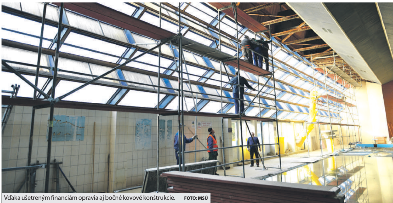
Vďaka ušetreným financiám opravujú aj bočné kovové konštrukcie.