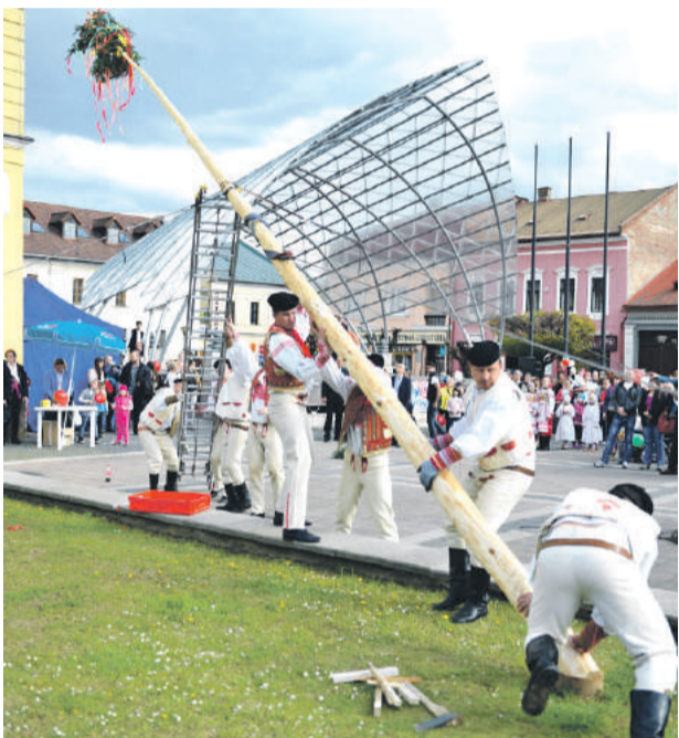
Máj postavili mocní chlapi z Mostáru a hasiči z Brezna.

Piatkové popoludnie bolo skutočne pestré. Bohatý program v podobe tancov a spevov ponúkli domáce folklórne súbory Šťastné detstvo a Mostár a počas dňa verejnosti priblížili svoju prácu aj lesní pedagógovia z Odštepneho závodu Beňuš a Lesov mesta Brezno, ktorí pripravili niekoľko aktivít. Obdiv u najmenších si získal hlavne poľovnícky stánok či spoznávanie semienok lesných drevín. (md)