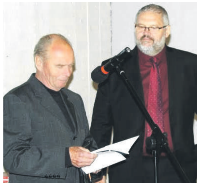
Prezentácia knihy Kosodrevie v Múzeu SNP.