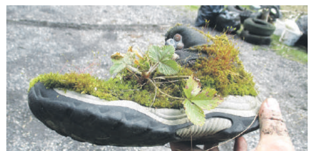
Rozum zostáva stáť nad tým, čo všetko sú ľudia schopní vyhodit do prírody.

Po príchode na Jarabú sa rozdelili úseky a skupiny z turistov, mladých hasičov z Beňuša a pracovníkov Lesov mesta Brezno. Po rozvoze na úseky sa mohol začať „zber“. Rozum zostáva stáť nad tým, čo všetko sú ľudia schopní vyhodit do okolitej prírody – pneumatiky, handry, obuv, epedá, autosúčasťi, množstvo naplnených vriec plastovými či sklenenými fľašami, plechovkami z piva