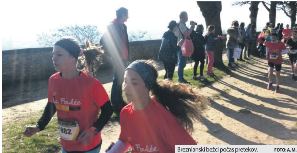
Breznianski bežci počas pretekov.

Meudon, ako partnerské mesto Brezna, pozvalo na tradičné medzinárodné bežecké pretekaj aj reprezentačný tím zo srdca Horehronia.