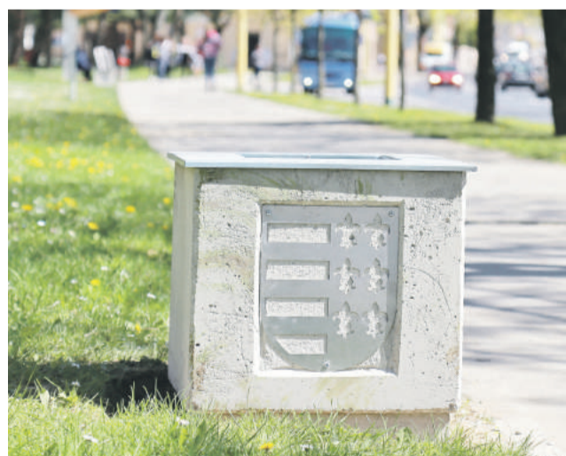
V uliciach Brezna postupne pribúdajú jednotné odpadkové koše s erbom mesta.

Ani v Brezne, žiaľ, nie je ničím výnimočným pravidelné znečisťovanie verejných priestranstiev a množstvo odpadkov, končiacich mimo nádob na to určených. Problém sa kompetentní rozhodli riešiť nezvyčajným spôsobom a neraz nevábné pôsobiace či zničené odpadkové koše onedlho nahradia novými, ktoré sú okrem praktickej funkcie zaujímavé aj svojím vzhľadom. Nápad vznikol na investičnom odbore mestského úradu a zrealizovali ho Technické služby mesta Brezno v spolupráci s miestnymi firmami, ktoré dodávateľsky zhotovili nerezové vložky a pozinkované erby. Zamestnanci technických služieb zasa vyrobili šablóny a zvyšné betónové dielce. Celkovo má