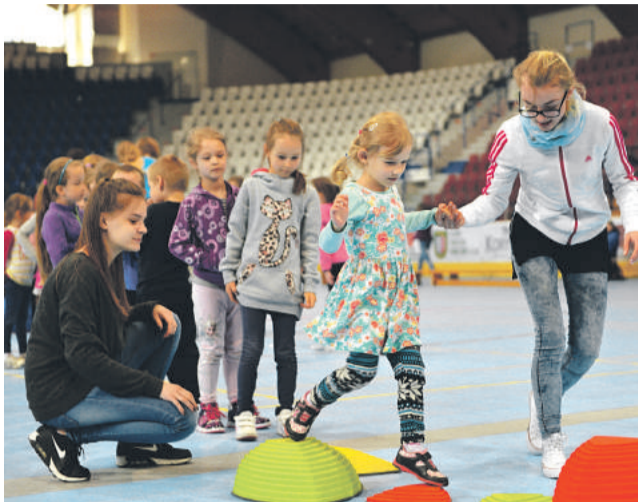
Do národného projektu BUĎ FIT sa zapojili aj breznianski školáci a škôlkari.