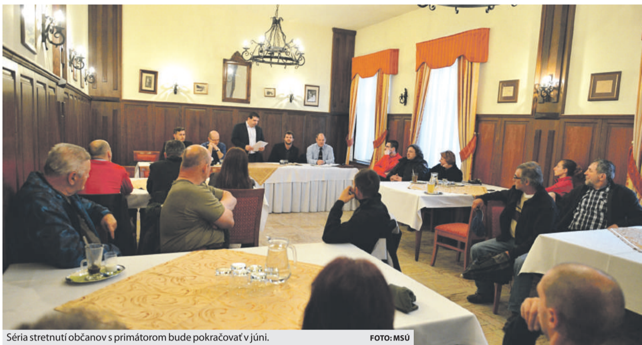
Séria stretnutí občanov s primátorom bude pokračovať v júni.