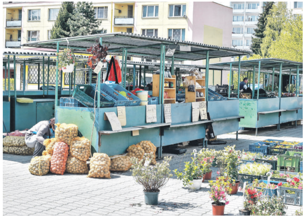
Tržnica sa v žiadnom prípade nezruší.

Trvalé presťahovanie tržnice teda nie je na programe dňa a primátor tiež zdôraznil, že akékoľvek kroky by mesto podniklo až po dôkladnom prediskutovaní zámeru s verejnosťou. Podmienkou takéhoto kroku by bolo celkové zvýšenie komfortu pre obchodníkov aj kupujúcich. „Trhovníci zatiaľ o ničom nevedeli, pretože žiadny konkrétny návrh neexistuje. Hodnotiť návrh bez toho, aby sme vedeli, kam presne a za akých podmienok ideme ob-