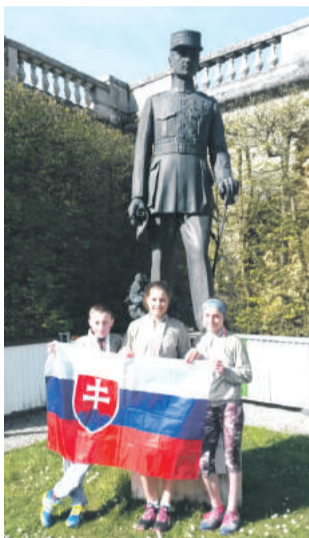
Pri soche gen. M. R. Štefánika v Meudone.