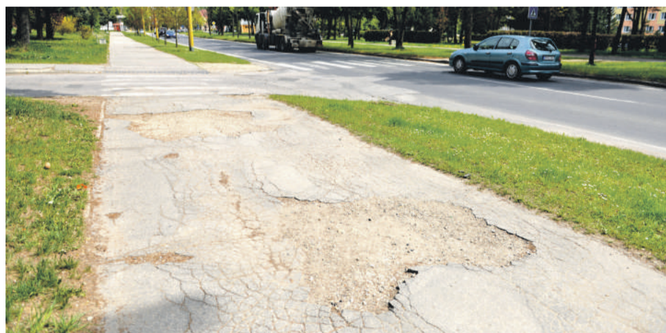
Do prvej etapy opráv sú zaradené najporušenejšie a najvyťaženejšie chodníky.

V tomto roku sa samospráva prioritne pustí do opráv chodníkov na piatich z celkovo dvadsiatich vytypovaných uliciach v Brezne. „Začíname tými najhoršími v meste a tiež takými, kde sa vieme dohodnúť s vodármi kvôli sieťam v komunikácii, aby boli súčinní pri výmene potrubí, ktoré sú veľmi poruchové,“ uviedla