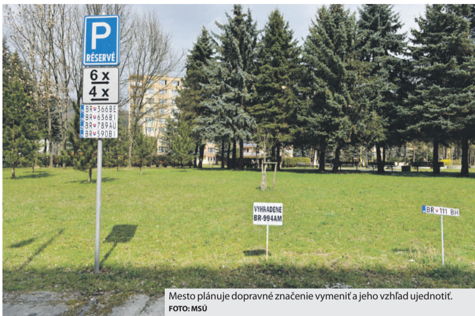
Mesto plánuje dopravné značenie vymeniť a jeho vzhľad ujednotiť.