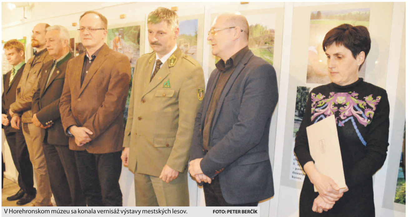
V Horehronskom múzeu sa konala vernisáž výstavy mestských lesov.

Upozornenie: na poukážky majú nárok len seniori, ktorí sú občanmi Slovenskej republiky