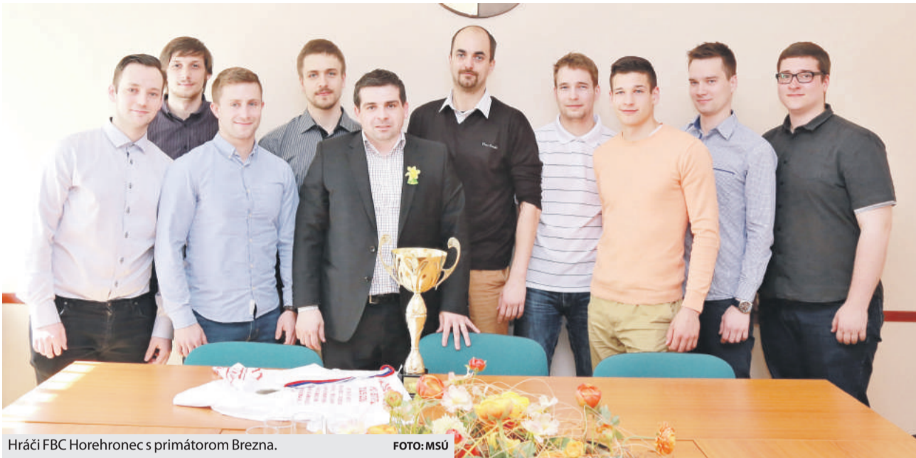
Hráči FBC Horehronec s primátorom Brezna.