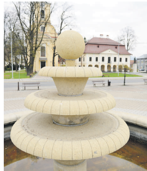
Fontány v Brezne spustia do konca mesiaca.