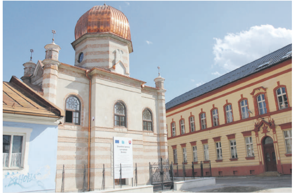
Breznianska synagóga po rekonštrukcii.

Aby budova s výbornou akustikou mohla plniť svoj účel pravidelne a akcie, ktoré sa v nej uskutočnia boli čo najpestrejšie, prišla breznianska samospráva s myšlienkou dlhodobej aktívnej spolupráce s umeleckou obcou. Po dotiah-