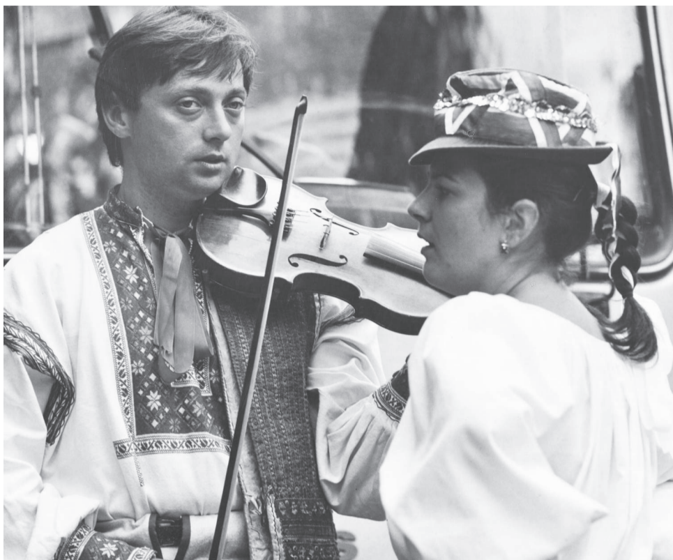
Mostárenci sa vďaka fotografii Petra Berčíka dostali do Zlatého fondu.

Pracoval si v Mostárni, nejaký čas pri železničiach a napokon aj v nemocnici. Na ktoré obdobie spomínaš najradšej?