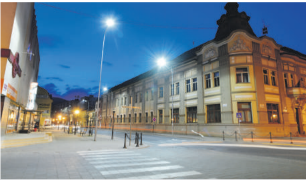
Z 1066 svietidiel v meste už stihli nainštalovať približne 700.

Na projekt modernizácie verejného osvetlenia mesto získalo finančné prostriedky z ministerstva hospodárstva vo výške viac ako 650 tisíc eur a po jeho realizácii očakáva až 40-percentnú úsporu energií. Termín ukončenia prác do veľkej miery závisí od vývoja počasia, pri súčasnom tempe by to však breznianske Technické služby chceli stihnúť najneskôr do polovice mája. (eš)