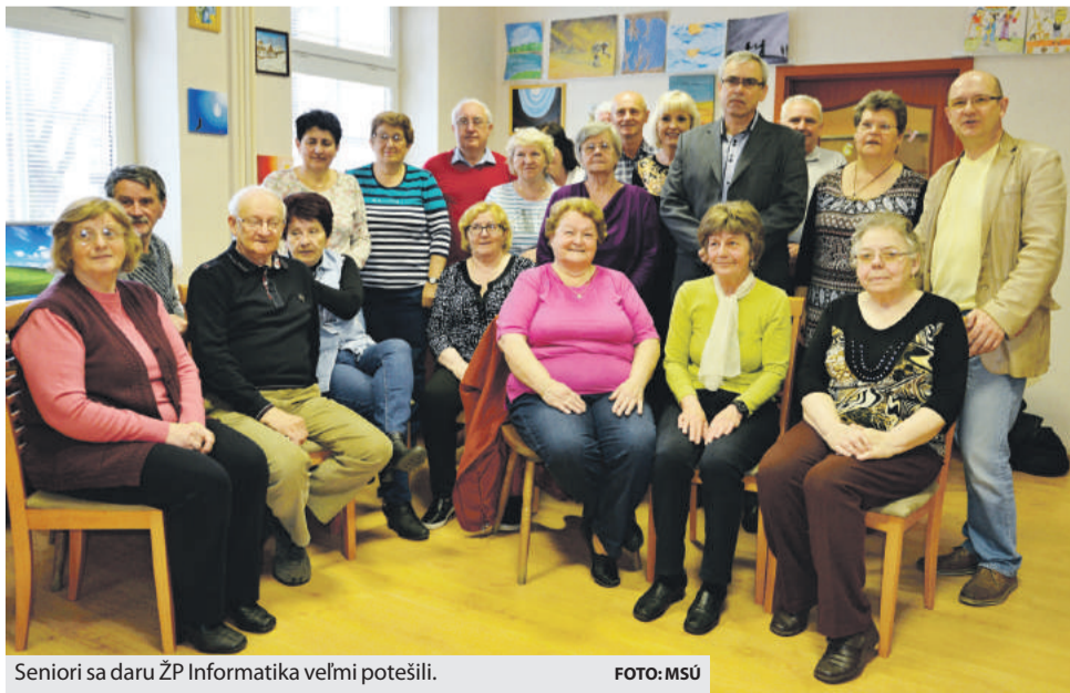
Seniori sa daru ŽP Informatika veľmi potešili.