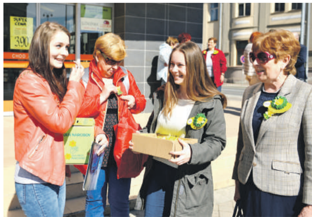
V Brezne na Deň narcisov sa vyzbieralo 4500 eur.

V uplynulý piatok sme v uliciach miest a obcí stretávali dobrovoľníkov s pokladničkami, do ktorých sme mohli vhodiť ľubovoľný finančný príspevok. Symbolom Dňa narcisov bol už tradične kvietok nádeje a ľudskej vzájomnosti, ktorý si ľudia pripli na svoj odev, aby aj týmto spôsobom vyjadrili solidaritu s osobami postih-