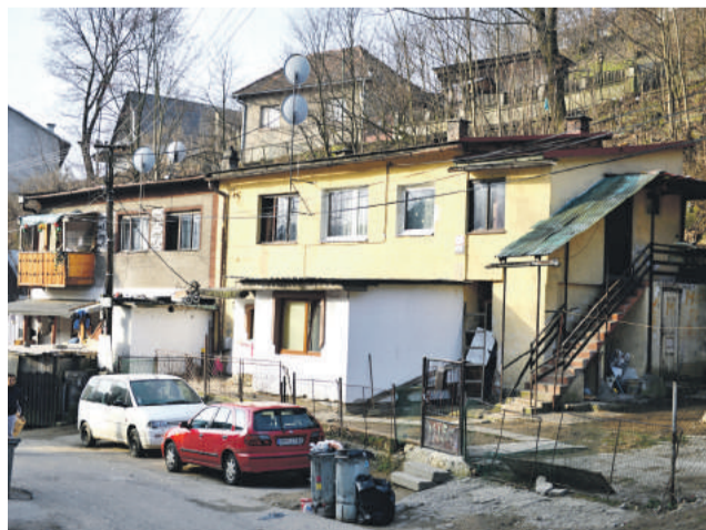
Čierne stavby sú neslávnou súčasťou Brezna.

Zamestnanci mestského úradu nemajú možnosť celý proces výraznejšie urýchliť a sú viaza-