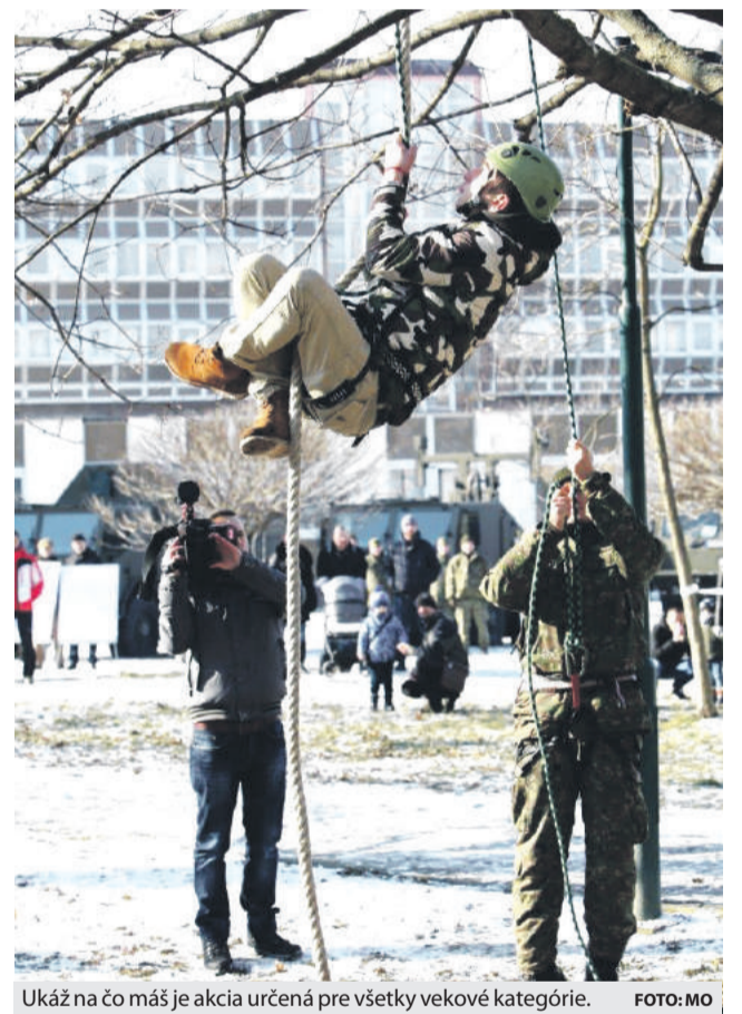
Ukáž na čo máš je akcia určená pre všetky vekové kategórie.