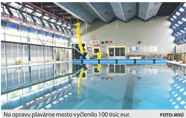
Na opravu plavárne mesto vyčlenilo 100 tisíc eur.