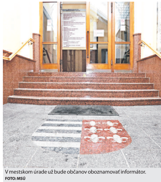
V mestskom úrade už bude občanov oboznamovať informátor.

Na vrátnici, resp. za pultom ovládaným ako turniket, v mestskom úrade zamestnajú cez projekt pracovníka, registrovaného v evidencii uchádzačov o zamestnanie, ktorého bude dotovať úrad práce. Podľa prednostu musí mať všeobecné povedomie o jednotlivých funkciách mestského úradu, o tom, aké sú jeho kompetencie, kto čo zabezpečuje, aby vedel poradiť klientom, na koho sa majú obrátiť so svojou žiadosťou, preto službu informátora považuje za veľmi užitočnú. (md)