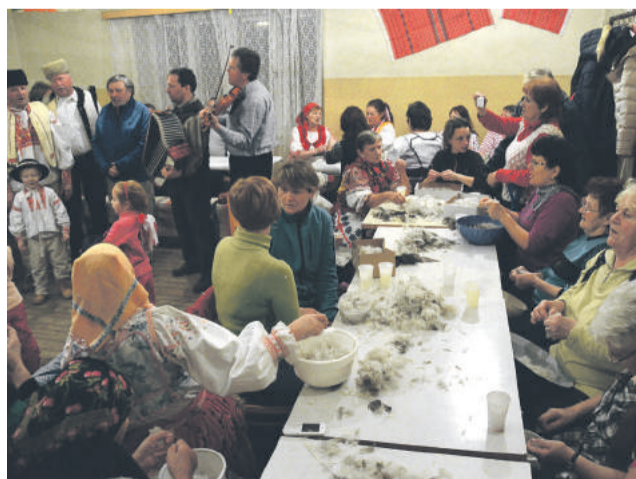
V Bujakove popri práci spievali, tancovali a hodovali.