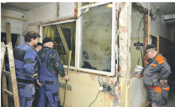
Práce na vrátnici.

V odhadoch na opätovné sprevádzkovanie plavárne je však vzhľadom na rozsah poškodenia strechy opatrný. „Kedy bude otvorená, sa momentálne nedá povedať. Závisí to od projektu a kým ho nemám v rukách, neviem spraviť rozpočet ani stanoviť presný harmonogram prác,“ uzavrel Lukáč. V záujme mesta však je, aby to bolo čo najskôr. (eš)