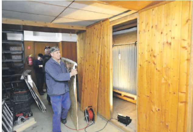
Vďaka technickým službám by sa efektívnosť vykurovania mala zvýšiť.

Po minuloročnej digitalizácii kina Mostár, vďaka ktorej sa zvýšila návštevnosť, mesto pristúpilo k ďalšiemu pozitívnemu kroku na zlepšenie komfortu priestorov breznianskeho kultúrneho stánku. Technické služby zabránili únikom tepla,