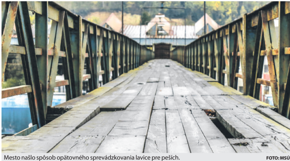
Mesto našlo spôsob opätovného sprevádzkovania lavice pre peších.

Jednotlivé kroky nám priblížila vedúca investičného odboru Mestského úradu v Brezne