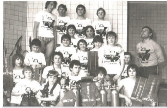
Plavci a športový potápač z roku 1979 so svojím trénerom.

- hlavne tým, že na Slovensku existuje len úzka základňa mladých talentov a pokiaľ rodičia nemajú finančné prostriedky na ich ďalší výkonnostný rast, nemôžu pokračovať vo svojej športovej činnosti. Kým sa v slovenskom lyžovaní nezmení celý systém od základu - výber talentov, športové triedy, športové strediská - viď alpské krajiny, viac finančných prostriedkov zo štátneho rozpočtu a kontrola hospodárenia s nimi, nemôžeme hovoriť o znovuzrození slovenského vrcholového lyžovania.