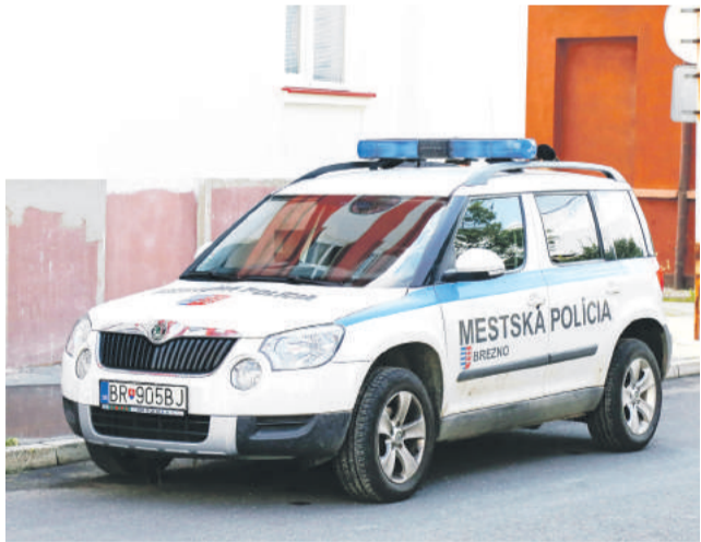
Mestská polícia má nové posily.

Hliadky boli prioritne zriadené za účelom monitorovania situácie, kontrolovania a zabezpečovania všeobecného