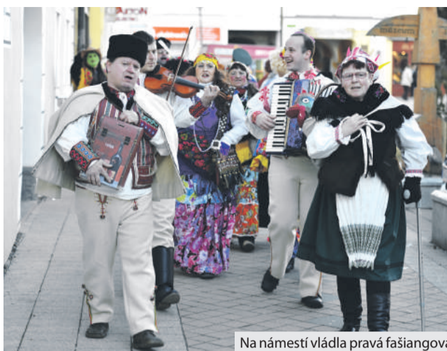
Na námestí vládla pravá fašiangová atmosféra.