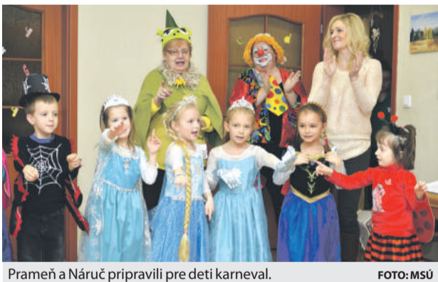
Prameň a Náruč pripravili pre deti karneval.

Náruč pripravili pre tieto deti karneval. Zavítali medzi nich aj deti z občianskeho združenia Ajka Brezno a z Materskej školy na Ulici B. Němcovej, ktoré si pripravili pekný program. Deti sa veľmi tešili z pestrofarebného šaša, ktorý ich karnevalom sprevádzal. Každá maska bola odmenená pochvalným listom a sladkosťou. No a ako na každom správnom karnevale nechýbali pampúšky, ani tombole, ktorá bola plná vtipných a netradičných výhier. Záverom masky zaplnili tanečný parket a pridali sa všetci, pretože pozitívna energia, ktorú rozdávali inak obdarení ľudia, ovládla každého, kto na karneval prišiel. (j)