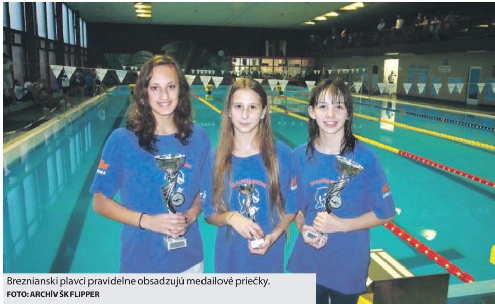
Breznianski plavci pravidelne obsadzujú medailové priečky.

Dvojfázový tréning každý deň v týždni priniesol rapidne zlepšenie každého plavca a tak prvé medailové umiestnenia športovcov vtedajšieho plaveckého oddielu TJ Mostáreň Brezno nenechali na seba dlho čakať. Výraznou osobnosťou sa v tom