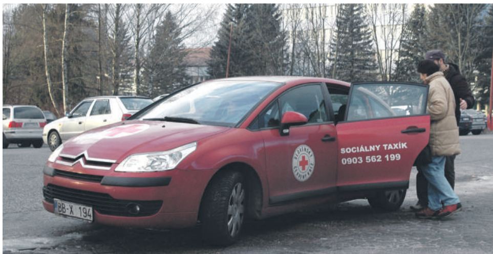
Sociálny taxík stále zaznamenáva pozitívne ohlasy.

V snahe zabezpečiť včasnú prepravu klientov do zdravotníckych zariadení, najmä