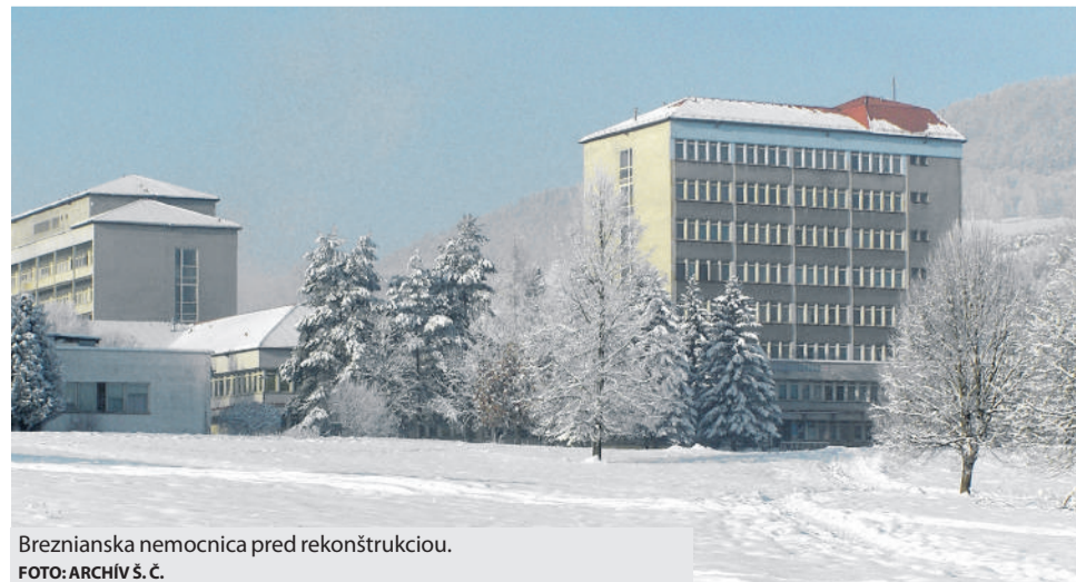
Breznianska nemocnica pred rekonštrukciou.