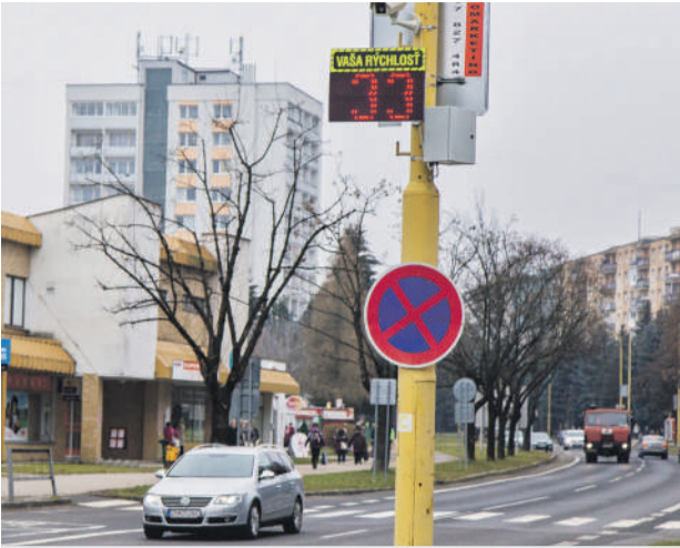
Mesto do najviac frekventovaných mestských častí umiestnilo merače rýchlosti.