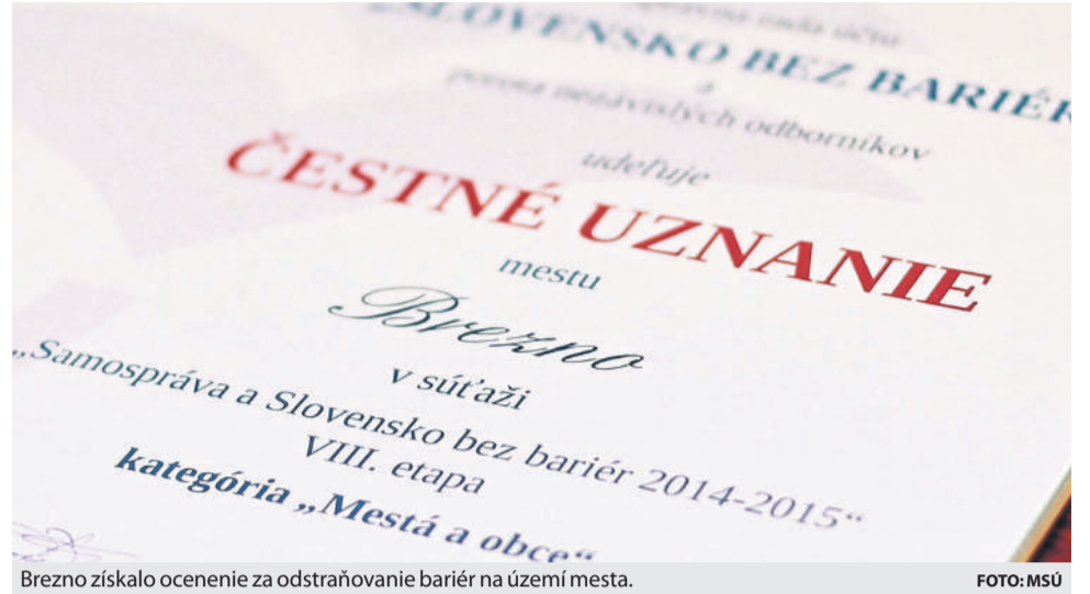
Brezno získalo ocenenie za odstraňovanie bariér na území mesta.