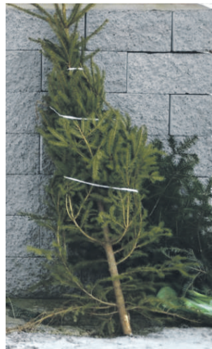
Živé vianočné stromčeky skončia v kompostárni.

Po Troch kráľoch už takmer všetci odzdobujú vianočné stromčeky. Umelé odložia do pivnice, na pôjd, živé obyvatelia rodinných domov možno spália, z činžiakov ich zasa odnesú ku kontajnerom, odkiaľ ich odvezú Technické služby.