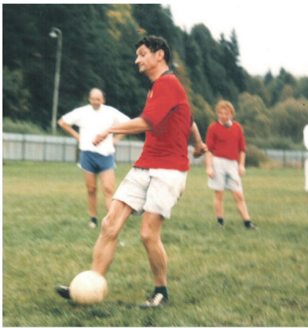
Z tréningového kurzu.