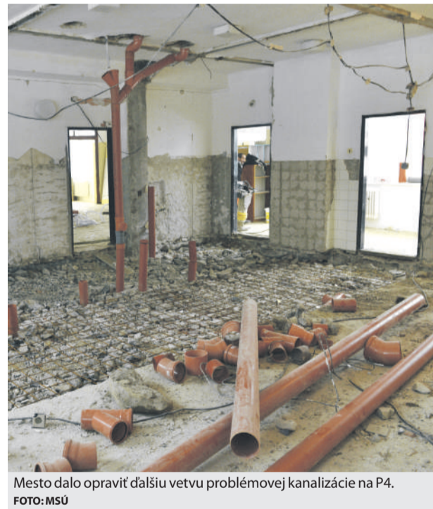
Mesto dalo opraviť ďalšiu vetvu problémovej kanalizácie na P4.