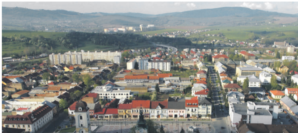
Brezňania sa môžu tešiť na pozitívne zmeny.

Mesto nezabúda ani na požiadavky obyvateľov mestských častí a vyhovieť chce aj im. „Určite by sme radi uzavreli otázku vody v Podkoreňovej, tiež cesty, chodníka pre jednotlivé časti Bujakovo, Zadné Halny, Vrchdolinka, kde prebiehajú projektové prípravy.“ Občania sa tiež môžu tešiť na prepojenie starého Mazorníka s novým, ku ktorému mesto doposiaľ nepri-