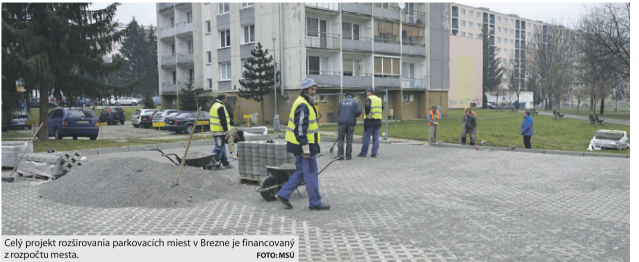
Celý projekt rozširovania parkovacích miest v Brezne je financovaný z rozpočtu mesta.