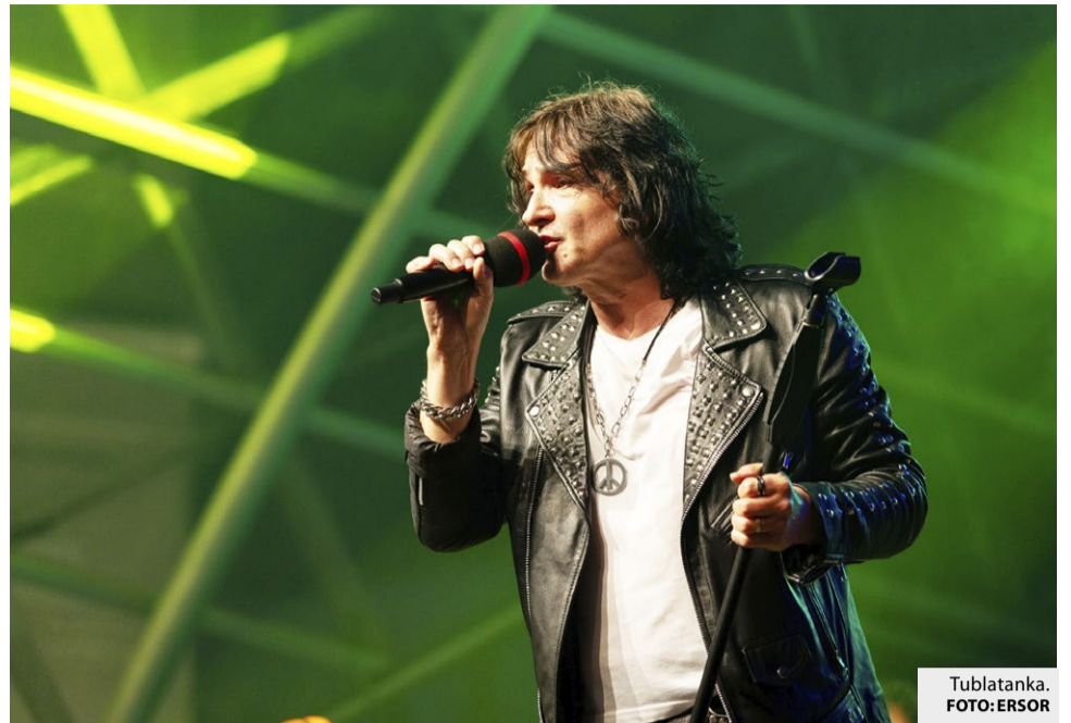
Tublatanka. FOTO: ERSOR