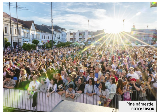
Plné námestie.