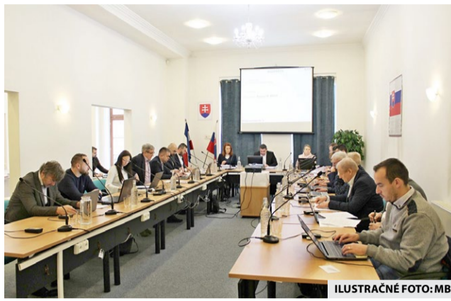
ILUSTRACNÉ FOTO: MB

V majetkových záležitostiach poslanci schválili odkúpenie jedného z posledných bytov v problémovom bytovom