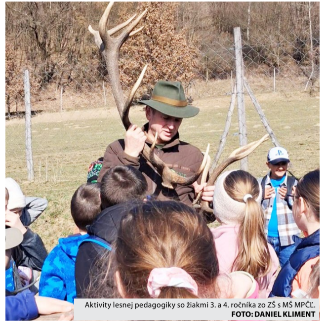
Aktivity lesnej pedagogiky so žiakmi 3. a 4. ročníka zo ZŠ s MŠ MPČL.