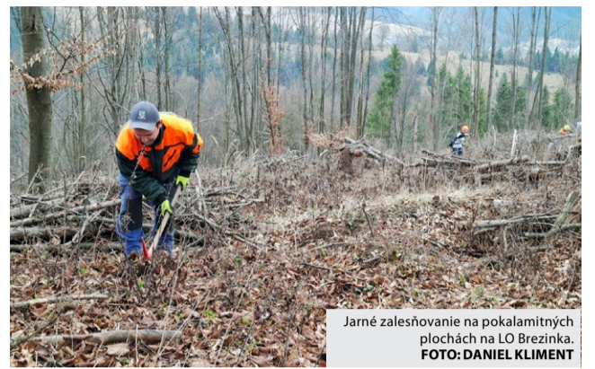
Jarné zalesňovanie na pokalamitných plochách na LO Brezinka.