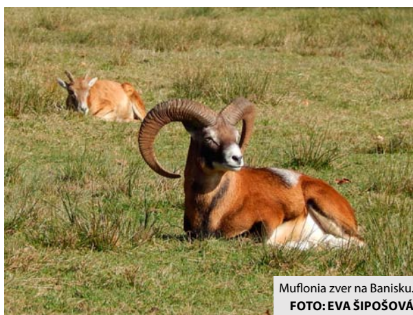
Muflonia zver na Banisku.

Najdôležitejšie a najrozšírenejšie krmivo pre raticovú zver v zimnom období je seno, ktoré patrí medzi objemové krmivá. „Z dužinatých krmív možno podávať siláž, senáž, prípadne niektoré druhy okopanín ako napríklad cukrovú repu, krmnú repu, mrkvu, zemiaky a podobne. Keďže toto krmivo je zväčša chudobné na vlákninu, nesmie sa zveri podávať samostatne, ale spolu s kvalitným senom,“ vysvetľuje Kliment. Ako ďalej pokračoval, okopaniny môžu byť v celku alebo nakrájané, ale nikdy nie