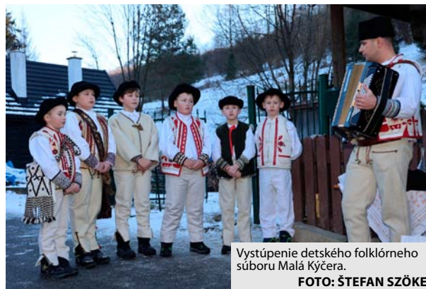
Vystúpenie detského folklórneho súboru Malá Kýčera.