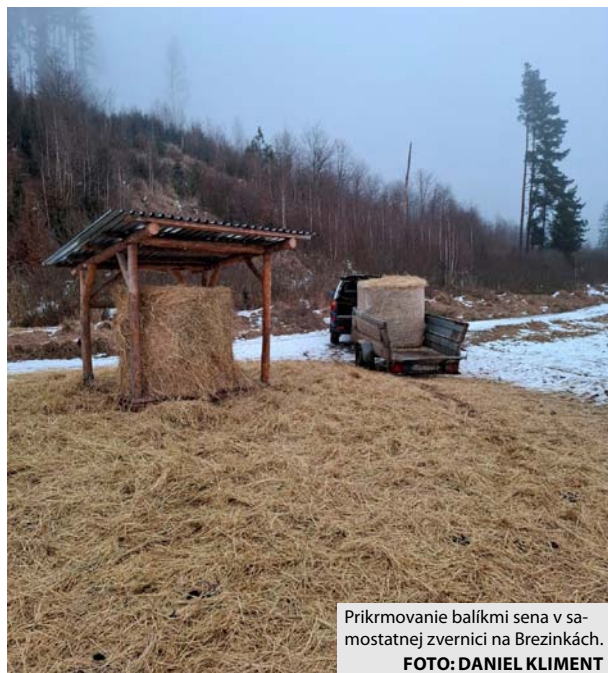
Prikrmovanie balíkmi sena v samostatnej zvernici na Brezinkách.