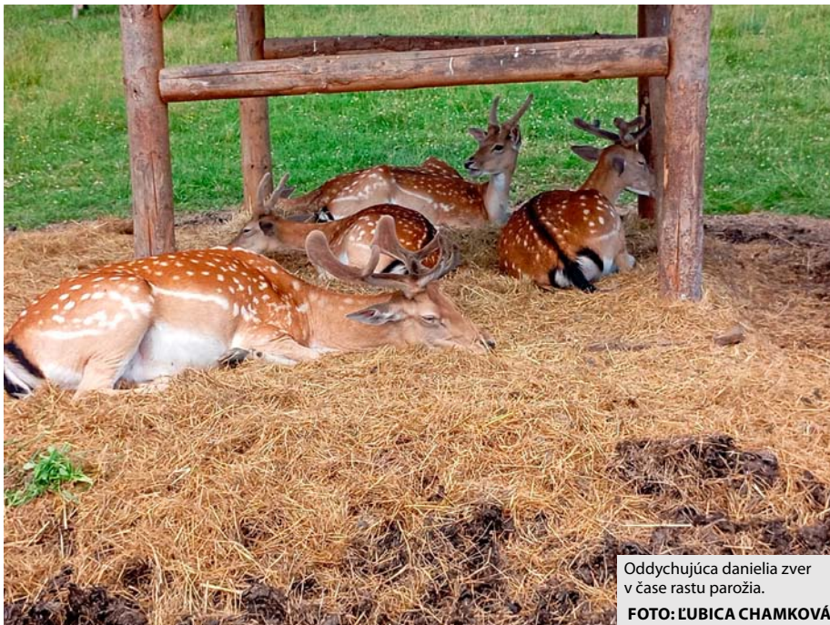
Oddychujúca danielia zver v čase rastu parožia.