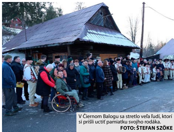
V Čiernom Balogu sa stretlo veľa ľudí, ktorí si prišli uctiť pamiatku svojho rodáka.