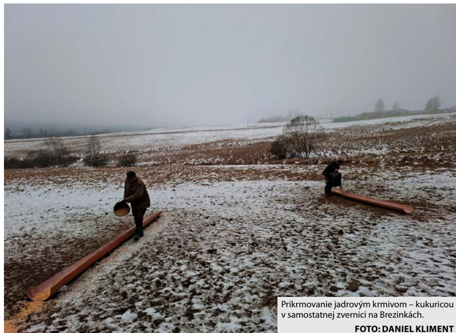
Prikrmovanie jadrovým krmivom – kukuricou v samostatnej zvernici na Brezinkách.