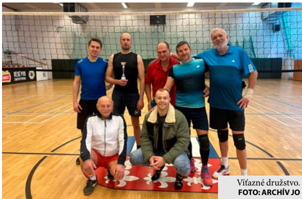
Vítané družstvo.