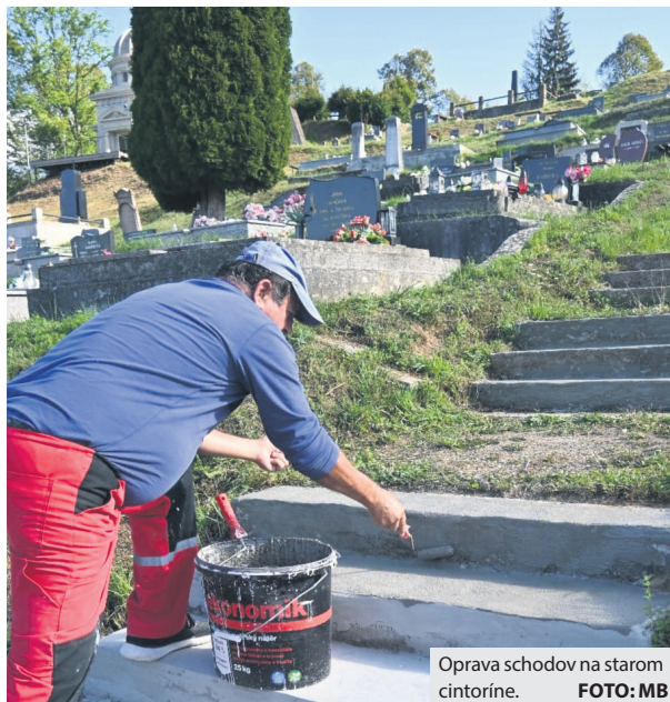
Oprava schodov na starom cintoríne.