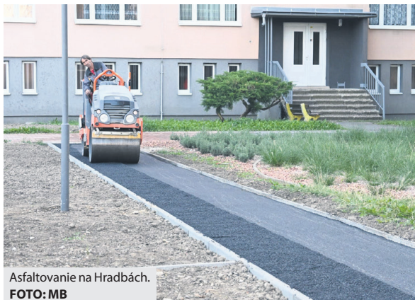
Asfaltovanie na Hradbách.