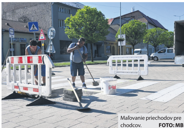
Maľovanie priechodov pre chodcov.