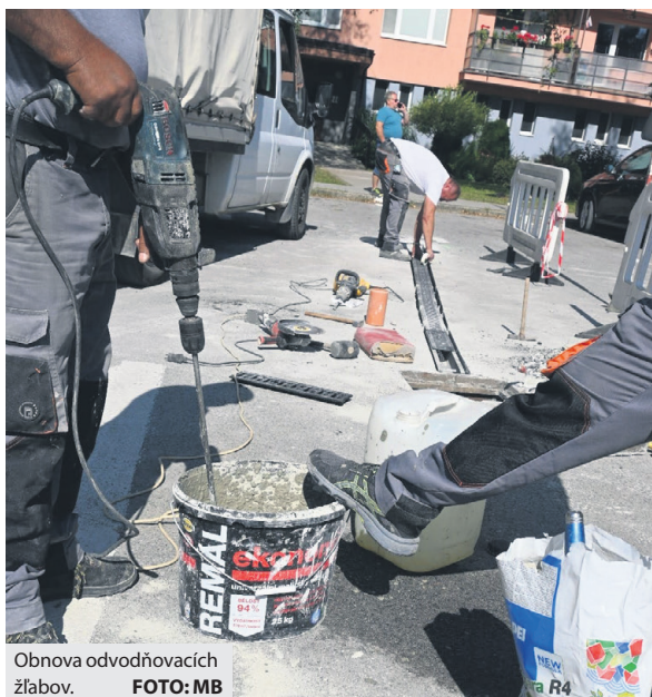
Obnova odvodňovacích žlabov.