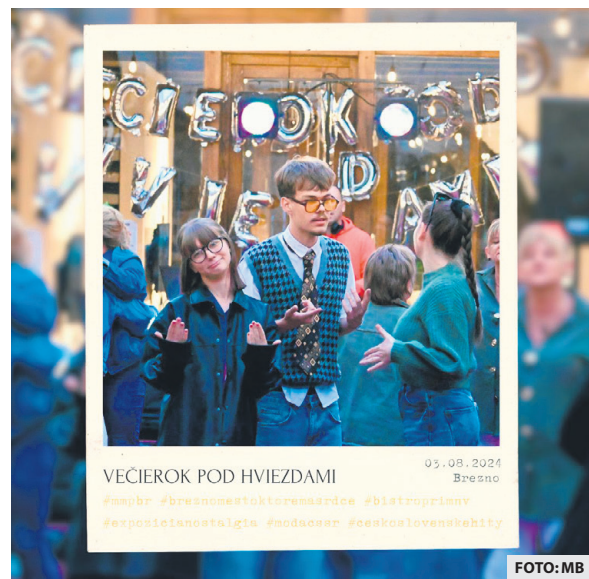
VEČIEROK POD HVIEZDAMI