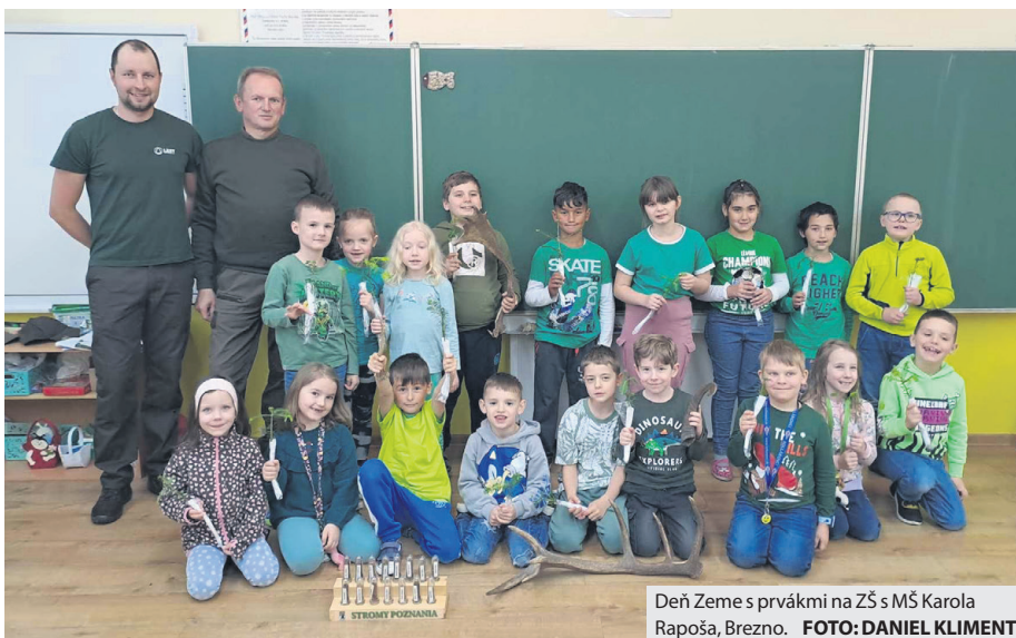
Deň Zeme s prvákmi na ZŠ s MŠ Karola Rapoša, Brezno.

Témou tohtoročného Dňa Zeme, ktorý si pripomíname 22. apríla, bola Planéta vs. plasty. Jej cieľom bolo upozorniť na znečistenie spôsobené zvýšeným používaním plastov. Lesní pedagógovia preto vyzdvihli význam lesa, stromov a dreva ako obnoviteľnej suroviny v prváku na ZŠ s MŠ Karola Rapoša, Brezno na Pionierskej 4. „Každý žiak dostal semenáčik jedle bielej, ktorý si mohol zasadiť doma do črepníka, v záhrade, alebo na oblúbenom mieste. Bola to pestrá vyučovacia hodina, plná zvedavých otázok,“ priblížil Daniel Kliment