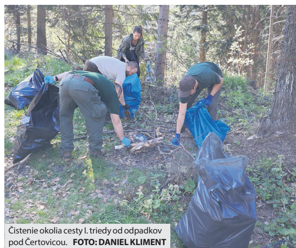
Čistenie okolia cesty I. triedy od odpadkov pod Čertovicou.