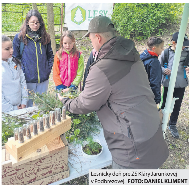
Lesnícky deň pre ZŠ Kláry Jarunkovej v Podbrezovej.

Horehronie na aktivity počas Lesníckeho dňa pre ZŠ Kláry Jarunkovej v Podbrezovej. Miestny park bol ako stvorený na rozloženie celkovo desiatich stanovišť s rôznymi prvkami lesnej pedagogiky, na ktorých sa žiaci, vrátane škôlkarov, dozvedeli množstvo zaujímavých informácií o stromoch, lesoch, poľovníctve, zvieratách, profesii a pomôckach pre pilčíka a započúvali sa do zvukov od trubačov. „S potešením sme skonštatovali, že skôr tie mladšie ročníky poznajú základné dreviny, ich význam pre človeka v podobe či už produkcie dreva, alebo tzv. mimoprodukčných funkcií ako napr. tvorby kyslíka, zadržiavania vody, ochrany pôdy, životného prostredia pre vtáky a živočíchov a v neposlednom rade oddychu a tieňa pre človeka,“ zhodnotil Kliment.