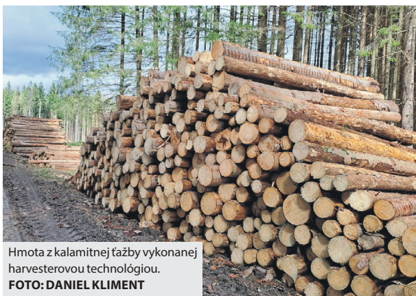
Hmota z kalamitnej ťažby vykonanej harvesterovou technológiou.

Už v druhej polovici roka 2022 Lesy mesta Brezno (LMB) spracovali o približne 15 tisíc metrov kubických smrekového dreva viac, ako plánovali, čo bolo predpokladom pre nárast náhodnej ťažby aj v roku 2023. Predpovede lesníkov sa naplnili a spolu vyťažili takmer 75 tisíc kubíkov prevažne podkôrníkovej kalamitnej hmoty. „Je to viac ako dvojnásobok toho, čo by sme mali vyťažiť za rok pri bežnom režime hospodárenia. Po predchádzajúcich rokoch postupného poklesu sme sa tak vrátili do obdobia rokov 2018 a 2019, kedy objem ťažby atakoval úroveň 70 tisíc metrov kubických za