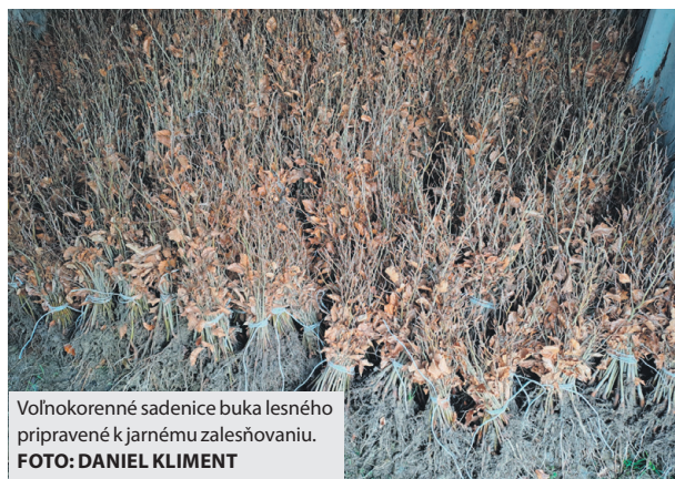
Voľnokorenné sadenice buka lesného pripravené k jarnému zalesňovaniu.

Plány mestských lesníkov však skrížil nadpriemerne teplý február, ktorý napriek tomu, že je zimný mesiac, pripomínal skôr začínajúcu jar. Denné aj nočné teploty boli nad nulou, sneh sa roztopil a pôda rozmrzla, čo značne sťažilo, prípadne znemožnilo pohyb lesnej techniky po porastoch. „Utrpeli aj lesné cesty, minulý rok sme investovali do ich údržby a opráv viac ako 110 tisíc eur a v tomto roku sa táto suma určite na-