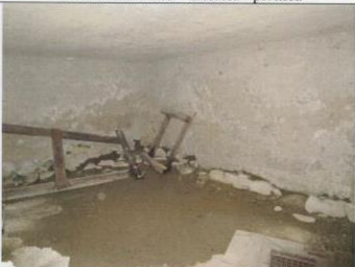
Polovnícka chata - interiér - pivnica