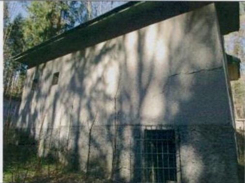
Polovnícka chata - exteriér