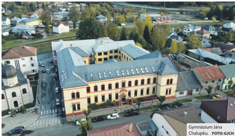
Gymnázium Jána Chalupku.

Pýtaš sa, kam po škole? Budeš pripravený rozbehnúť vlastné podnikanie v najrôznejších sférach, založiť si firmu, viesť podvojné účtovníctvo, stať sa úspešným