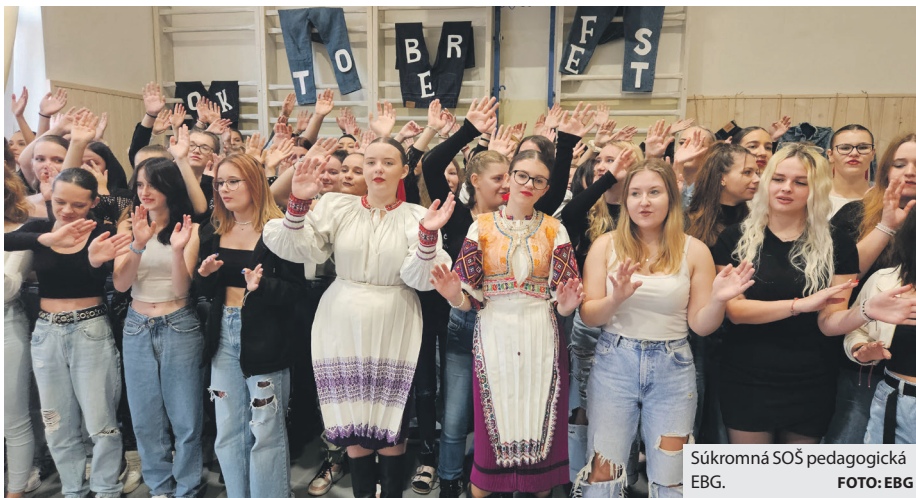
Súkromná SOŠ pedagogická EBG.