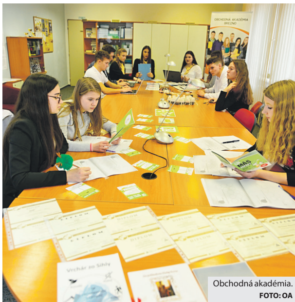
Obchodná akadémia.