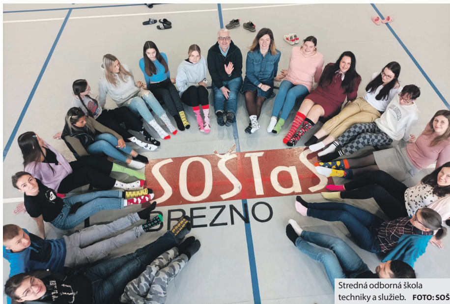
Stredná odborná škola techniky a služieb.

anglického a nemeckého jazyka ťa pripraví na tieto situácie.