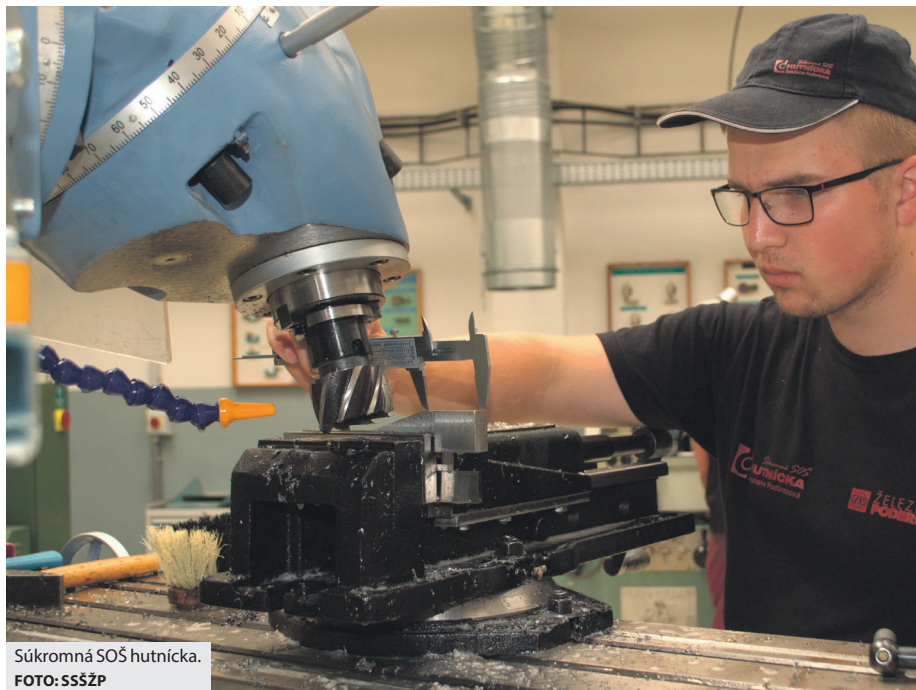
Súkromná SOŠ hutnícka.