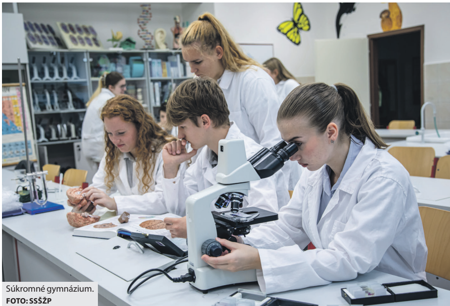
Súkromné gymnázium.

Ktoré benefity školy sú pre teba najzaujímavejšie?