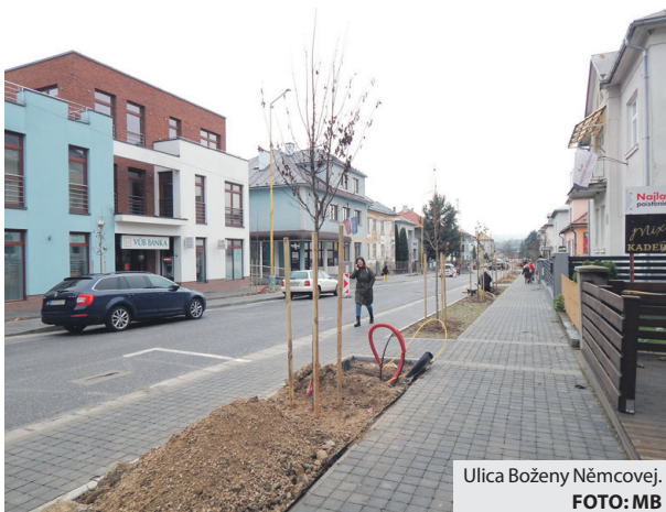
Ulica Boženy Němcovej.

V septembri 2020 sa v Brezne podarilo spustiť realizáciu druhej etapy obchvatu, ktorý mal z centra mesta odkloniť tranzitnú dopravu smerujúcu do Tisovca a Rimavskej Soboty. Výstavba 1,6-kilometrového úseku bola pôvodne naplánovaná na obdobie 30 mesiacov, všetko však skomplikovala pandémia, nárast cien materiálov a predovšetkým nečakaný problém so zosuvom pôdy. Pre Slovenskú správu ciest ako investora to znamenalo nielen predĺženie výstavby o približne pol roka, ale aj stopercentné navýšenie ceny diela z 20 na 40 miliónov eur. Nový úsek cesty, ktorý má pomôcť odbremeniť dopravu v centrálnej časti mesta, napokon motoristom odovzdali do predbežného užívania koncom septembra minulého roka. Vedenie breznianskej radnice už avizovalo, že bude robiť všetko pre to, aby