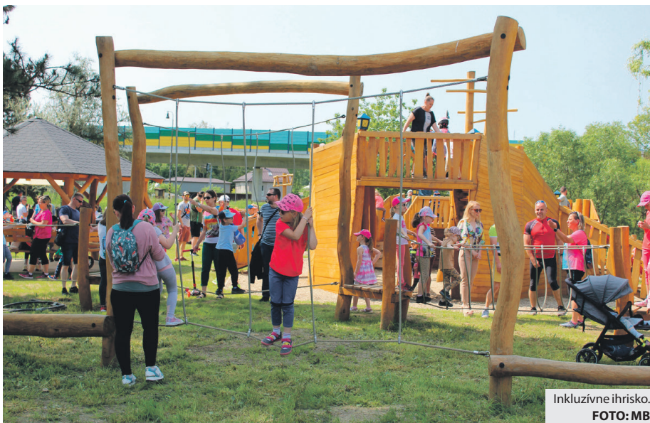
Inkluzívne ihrisko.

Brezníanska samospráva sa pred časom rozhodla prinavrátiť hotelu Ďumbier noblesu, aká mu prináleží. Ako vlastník objektu po uplynutí desaťročnej nájomnej zmluvy prevzala jeho správu a prevádzku do svojich rúk a začala s obnovou vonkajších priestorov. Hotel už má za sebou rekonštrukciu fasády, výmenu okien, náter strechy aj renováciu stravovacej časti. Mesto sa aj naďalej snaží zvyšovať jeho atraktivitu postupnými úpravami ubytovacích priestorov a zlepšovaním kvality poskytovaných gastronomických služieb. Cieľom je, aby his-