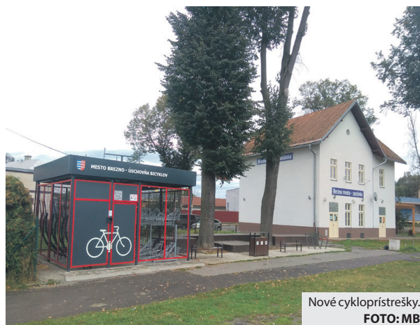
Nové cykloprístrešky...