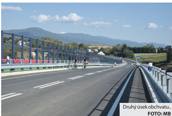
Druhý úsek obchvatu...

Samotný efekt jednotlivých opatrení bude viditeľný už na jar a v maximálnej miere zhruba o rok počas vegetačného obdobia.