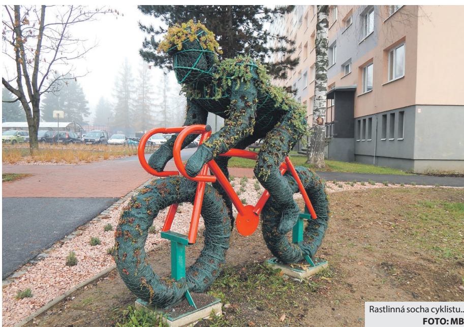
Rastlinná socha cyklistu...

Menej hluku, prachu a slnečného žiarenia, viac vody, vlhky a rozmanitosti živočíšnych druhov. Centrum Horehronia sa aj vlni snažilo prispôbiť dôsledkom globálneho otepľovania masívnou výsadbou zelene. Na tento účel získalo z Nórskeho finančného mechanizmu a štátneho rozpočtu takmer 92 tisíc eur. Nové lúčne spoločnosti, ktoré v porovnaní s bežnými trávnikmi nevyžadujú náročnú údržbu, tak pribudli na uliciach ŠLN, ČSA, Krčulova, Švermova, Jilemnického, Kuzmányho, ale aj na Mazorníkove a nábřeží Hrona. Okrem zelenej steny na stojisku na Malinovského ulici došlo na križovatke ulíc ČSA a Hradby k výsadbe zeleného ostrova a rovnako aj k osadeniu unikátnej rastlinnej sochy cyklistu. Projekt tiež počíta s podporou rozširovania včelstiev, motýľov a hmyzu vďaka rozmiestneniu 14 hmyzích domčekov.