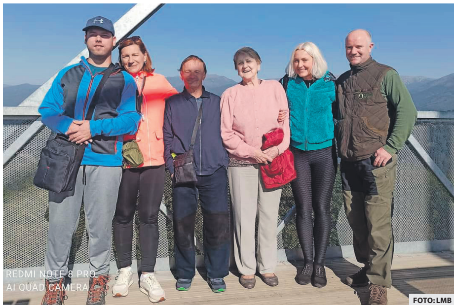
REDMI NOTE 8 PRO AI QUAD CAMERA

altánkom na Banisku. Kto mal záujem a odvahu, mohol sa autom odviezť pod vyhliadkovú vežu na Horných lazoch. Samotná cesta autom bola pre mnohých nevhodným zážitkom, nakoľko mohli obdivovať krásu prírody, kde by sa už, žiaľ, z dôvodu svojho zdravotného stavu nemali možnosť dostať. V ten deň im prialo aj počasie, slniečko hrialo a obloha bola rozprávkovo modrá. A tak každého lákalo zložiť množstvo schodov a vystú-