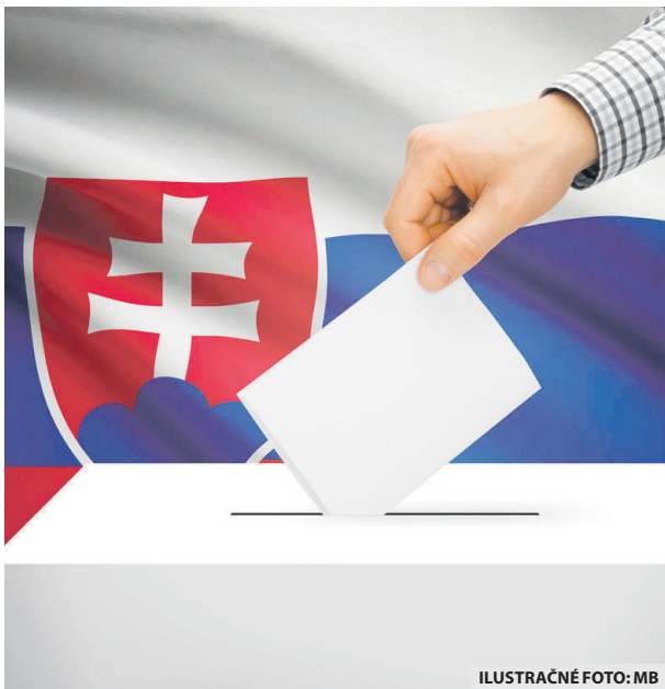
ILUSTRÁČNÉ FOTO: MB

Požiadať o preukaz možno aj listinne alebo elektronicky mailom tak, aby žiadosť bola doručená obci najneskôr 8. septembra. Obec je povinná odoslať preukaz najneskôr tri pracovné dni od doručenia žiadosti, teda najneskôr do 13. septembra, a to doporučenou zásielkou „do vlastných rúk“.