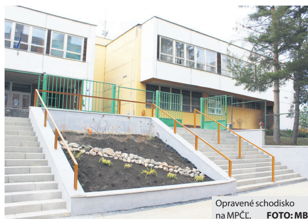
Opravené schodisko na MPČL.

Počas uplynulého roka zamestnanci TS nainštalovali takmer štyri desiatky nových štýlových lavičiek v rôznych častiach mesta. Vyznačujú sa nielen trendovým vzhľadom, ale aj kvalitným prevedením a trvácnosťou použitých materiálov. Sú totiž vyrobené z jatoby, exotickéj dreviny známej ako brazílska čerešňa, ktorá pochádza zo subtropických lesov južnej a strednej Ameriky. Jej drevo je veľmi tvrdé, vďaka čomu je vysoko odolné voči hnilobe, plesniam, hubám, hmyzu a dokonca aj vandalom. Samospráva už avizovala, že postupne bude dokupovať ďalšie a v rámci mesta ich bude umiestňovať podľa požiadaviek obyvateľov.