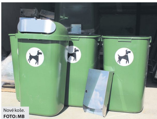
Nové koše.

Pozornosť mesta sa sústreďuje aj na detské ihriská, ktoré sú súčasťou zariadení v jeho zriaďovateľskej pôsobnosti. Nielenže v jednotlivých školských areáloch postupne buduje nové, ale obnovuje aj existujúce ihriská, ktoré doplnia o hracie prvky. Minulý rok sa napríklad z nových hojdačiek mohli tešiť škôlkari z materských škôl na uliciach Dr. Clementisa a kpt. Nálepku, a novú hernú zostavu určenú na rozvoj pohybových aktivít dostali aj žiaci ZŠ s MŠ na Pionierskej 2. Keďže detské ihriská vo všeobecnosti poskytujú príležitosť na rôzne spoločenské interakcie vhodné pre zdravý vývoj detí, samospráva chce v nastúpenom trende pokračovať. (eš)