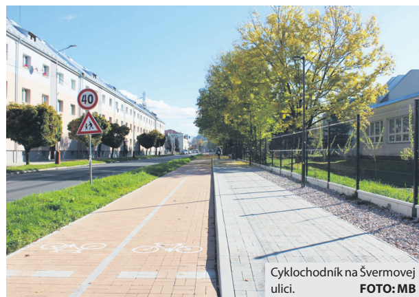
Cyklochodník na Švermovej ulici.