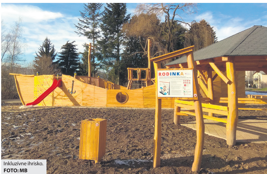
Inkluzívne ihrisko.

Desať kusov plastových nádob na psie exkrementy rozmiestnili Technické služby Brezno v závere roka do najviac frekventovaných psíčkarských zón v meste. Špeciálne 50-litrové nádoby sú vybavené klapkou proti šíreniu zápachu a uzamykateľným zásobníkom s hygienickými vrecúškami na zber zvieracích výkalov. Samospráva tak vyšla v ústrety majiteľom psov, ktorí sú počas venčenia povinní odstraňovať exkrementy svojich domácich miláčikov z verej-