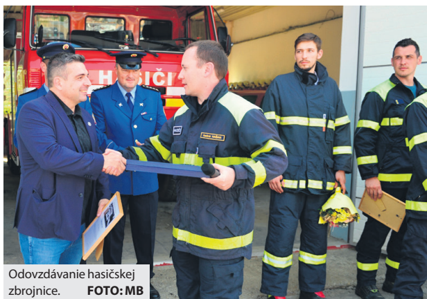
Odvodzovanie hasičskej zbrojnice.

Plak na zvyšovanie kapacít statickej dopravy je enormný, no priestorové možnosti samospráv sú značne obmedzené. Aj napriek týmto limitom mesto pristupuje k riešeniu parkovacej otázky aktívne a pomerne pružne sa mu darí reagovať na požiadavky motoristov. Aj vlani pokračovalo v rozširovaní a rekonštruovaní odstavňných plôch na uliciach Hradby, 9. mája, Fraňa Kráľa, Krčulo-