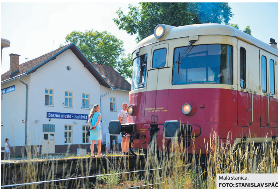
Malá stanica.

Podmienky na výkon činnosti Dobrovoľného hasičského zboru mesta sa vlani