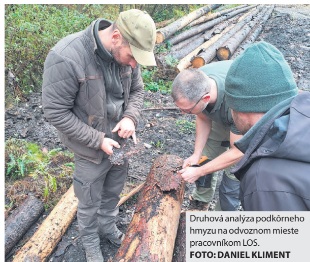
Druhová analýza podkôrneho hmyzu na odvoznom mieste pracovníkom LOS.

Začiatkom decembra navyše mestskí lesníci potešia viaceré domácnosti, keď na breznianskom námestí budú predávať živé vianočné stromčeky. Ceny sa budú pohybovať podľa veľkosti od 5 do 23 € s DPH za kus. O presných predajných dňoch a hodinách budú včas informovať prostredníctvom svojej webovej stránky a facebookových profilov mesta a LMB. (dk, eš)