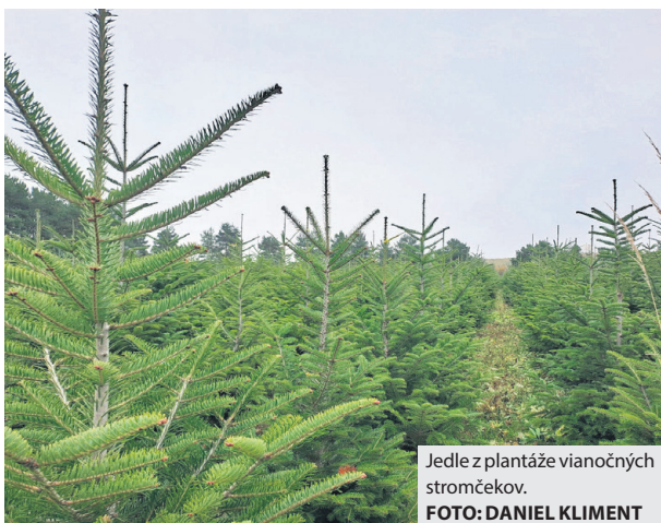
Jedle z plantáže vianočných stromčekov.