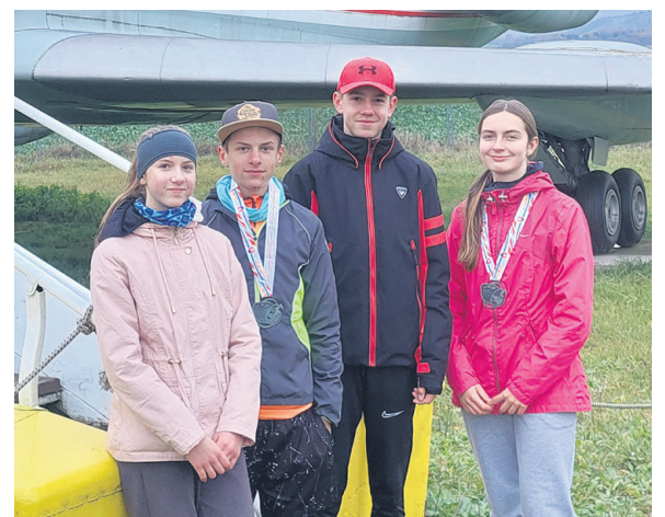
Mládežnícka časť výpravy AK Mostáreň Brezno na Majstrovstvách Slovenska v cezpoľnom behu.