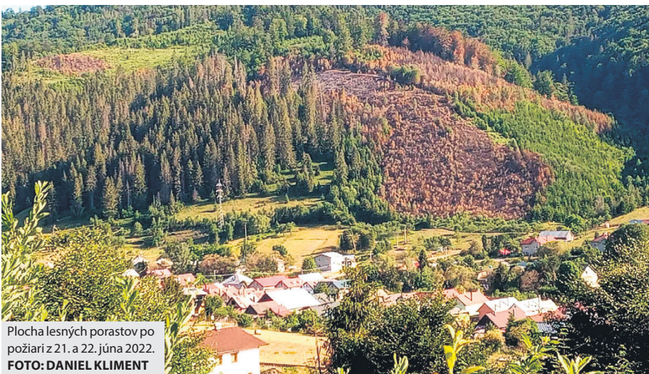
Plocha lesných porastov po požiar z 21. a 22. júna 2022.