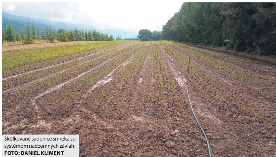
Škólkované sadenice smreka so systémom nadzemných závlah.

V tejto súvislosti mestské lesy apelujú na všetkých občanov, aby v tomto mimoriadne suchom počasí boli zodpovední a nemanipulovali s otvoreným ohňom, aby nedošlo k ďalším požiarom. A je jedno, či lesa alebo iných plôch, na všetkých totiž okrem priamych škôd utrpí aj množstvo fauny a flóry, ktorú by sme mali ako súčasť životného prostredia chrániť. (dk)