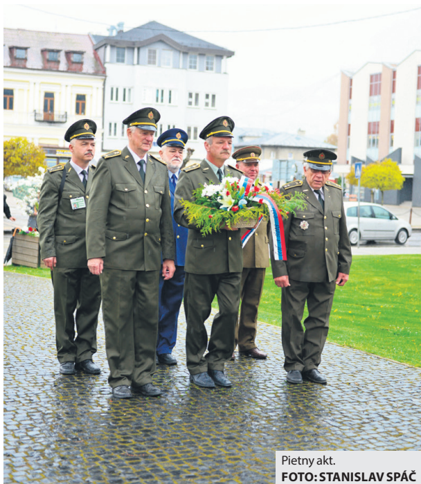
Pietny akt.

votom a smrťou. Je to úloha ťažká a nanajvýš citlivá pre politikov, diplomatov, ale aj pre nás všetkých. Sloboda je voľnosť, ale s ňou prichádza aj zodpovednosť za svoje činy a rozhodnutia, zodpovednosť za budúcnosť národa, preto dúfam kvôli nám, našim deťom, ale aj kvôli všetkým, ktorých sa súčasný vojnový konflikt priamo dotýka, že politici a diplomati nájdu cestu k jeho urovnaniu a to čo najskôr.“ (eš)