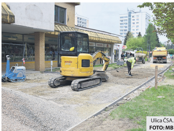
Ulica ČSA.

„Realizácia tejto obnovy bola naplánovaná na 6 mesiacov, no stavebné práce na chodníku kolidujú s plánovanou rekonštrukciou plynovodu. Dlažbu sme položili po výkop, kde budú plynári prepájať jednotlivé úseky, ďalšiu môžeme položiť až po ukončení prác zo strany SPP,“ informovali z investičného odboru.