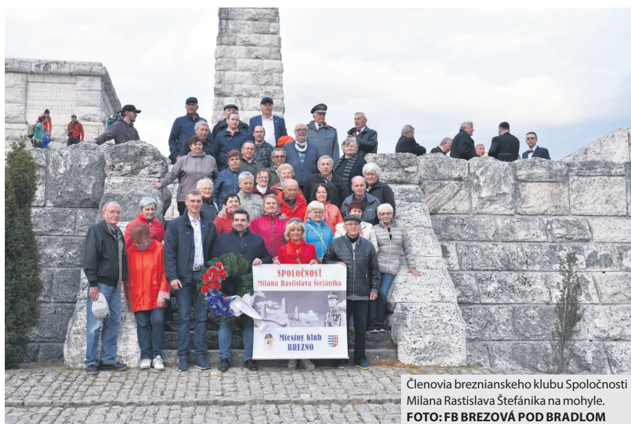
Členovia breznianskeho klubu Spoločnosti Milana Rastislava Štefánika na mohyle.