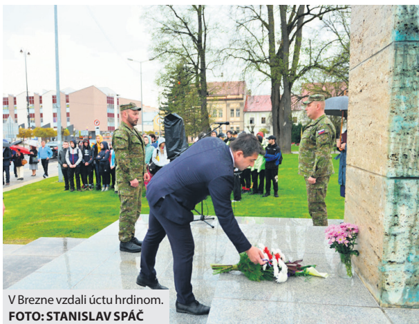
V Brezne vzdali úctu hrdinom.

„Generál Štefánik bol osobnosťou, ktorá nám