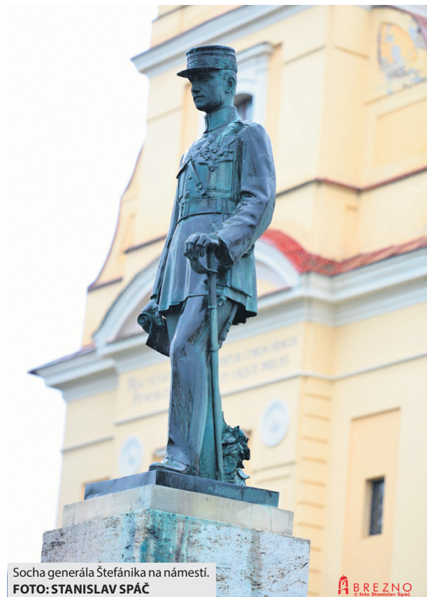
Socha generála Štefánika na námestí.

vodu bojovať opäť. Iba 21 rokov totiž stačilo na to, aby svet zachvátila ďalšia vojna. „Každoročne spomíname na námestí, ktoré nesie meno Štefánika, na všetko, čo museli obyvatelia Brezna prežiť po obsadení mesta okupačnými vojskami. Pietnym aktom vzdávame úctu a vďaka obetiam druhej svetovej vojny a všetkým hrdinom, ktorí sa dokázali postaviť útlaku a snahám o podrobenie si národov,“ pripomenul primátor a zdôraznil, že na to nikdy nesmieme zabudnúť. O to tragickejšie vyznieva fakt, že svet sa napriek všetkému nepoučil zo svojich chýb. „Dnes mi je o to ťažšie konštatovať, že v našej bezprostrednej blízkosti prebiehajú reálne boje, že opäť zbytočne zomierajú ľudia, že mnohí museli opustiť svoje domovy, zanechať za sebou všetko, čo si vybudovali a hľadať útočisko v cudzej krajine.“