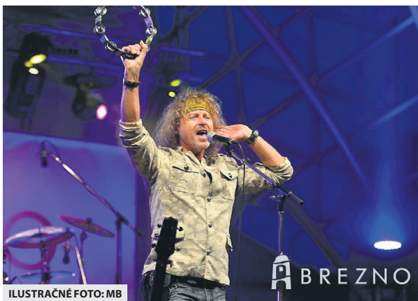
ILUSTRÁČNÉ FOTO: MB

Mestské oslavy a ich skladbu organizátori plánujú väčšinou od septembra, kde hlavnou úlohou je stanoviť si termín a hlavných interpretov, ktorí by mali vystupovať. „Veľké skupiny si rezervujú termíny niekedy aj rok dopredu, preto musíme s predstihom reagovať. Vlni