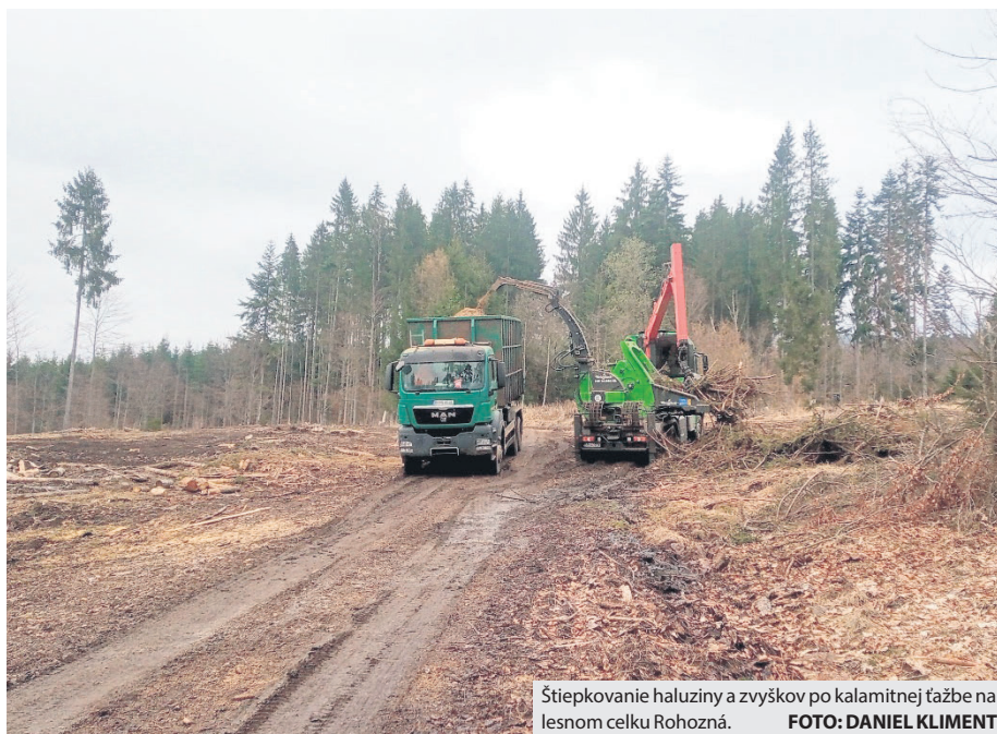
Štiepkovanie haluziny a zvyškov po kalamitnej ťažbe na lesnom celku Rohozná.

Aj keď sme donedávna mali pomerne silné nočné mrazy, začali sme s vyzdvihovaním sadeníc buka lesného, pestovaného vo fóliovníkoch. Akonáhle spomínané mrazy povolía, začneme vyzdvihovať aj sadenice smreka, jedle, javora a buka, ktoré pestujeme na voľnej ploche. V závislosti od vývoja počasia plánujeme pre vlastnú spotrebu vyzdvihnúť viac ako dvojnásobok toho, čo sa nám podarilo zalesniť minulý rok. So súčasným zaevidovaním prirodzenej ob-