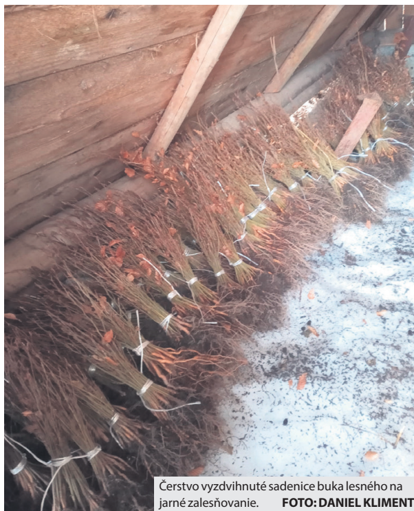
Čerstvo vyzdvihnuté sadenice buka lesného na jarnej zalesňovanej ploche.

Okrem ťažbových a pestovných prác, ktoré sú našou