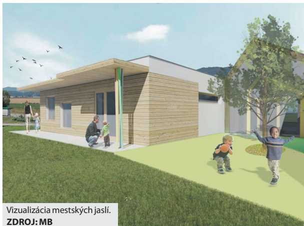
Vizualizácia mestských jaslí.

V rámci projektu budovania mestských cyklotrás bude pokračovať obnova chodníkov. Cyklochodník na Ulici ČSA povedie od kruhovej križovatky pri centre S1 po Point, pričom realizáciu na jednej strane ulice mesto spustilo na jeseň. Na jar začne s budovaním úseku pred obchodnými prevádzkami a tržnicou, ako aj chodníka na druhej strane Ulice