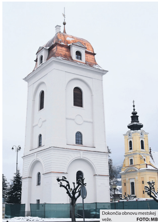
Dokoncia obnovu mestskej veže.

Od jari minulého roka je vo výstavbe aj futbalové ihrisko s umelou trávou v lokalite Banisko, nad Kauflandom. Pre nepriaznivé počasie práce boli na konci roka ukončené a pokračovať v nich budú hneď, ako to dovoľia podmienky. Hlavným cieľom projektu je deti a mlá-