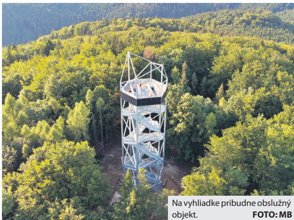
Na vyhladke pribudne obslužný objekt.

Samospráva sa vlni na jeseň pustila do obnovy miestnych komunikácií. Týka sa najpoškodenejších ciest, chodníkov a iných asfaltových povrchov v meste.