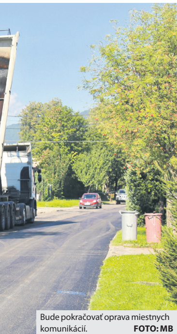
Bude pokračovať oprava miestnych komunikácií.

ČSA, ktorý bude rozdelený osobitne pre chodcov a cyklistov a prepojí centrum mesta až po Banisko. Úpravou prechádza aj chodník na Švermovej ulici, rozdelený na vyvýšenú časť pre chodcov a dvojsmerný cyklochodník. Na Rázusovej ulici v rámci cyklotrasy C2, C5 a C10 vznikne samostatný pruh pre cyklistov v oboch smeroch, označený na hlavnej ceste čiarou. Postupne v meste pribudnú aj ďalšie cyklochodníky.