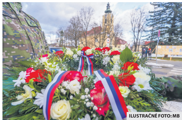
ILUSTRÁČNÉ FOTO: MB