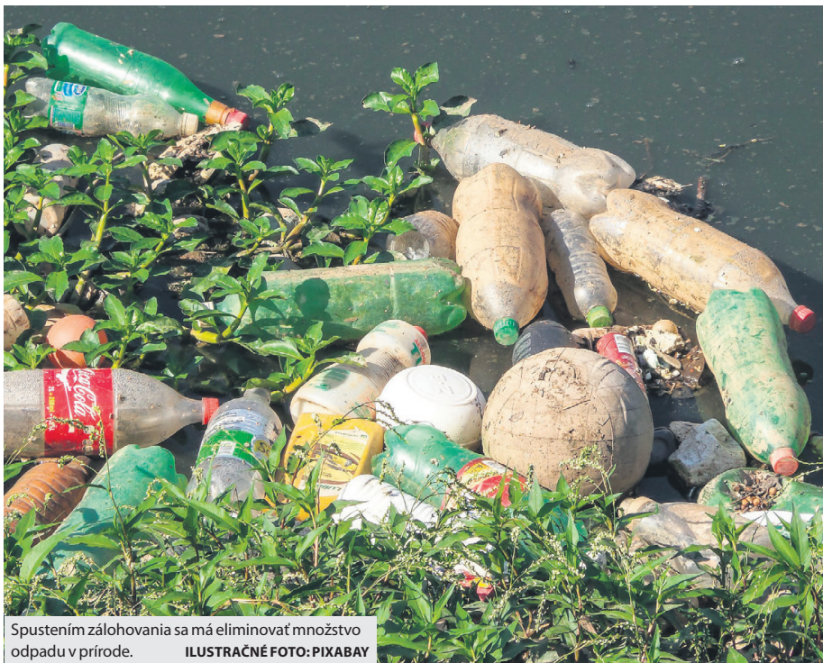
Spustením zálohovania sa má eliminovať množstvo odpadu v prírode.

Zálohovanie, ako jeden z účinných spôsobov cirkulárnej ekonomiky, sa týka všetkých nápojových obalov obsahujúcich viac ako 80 % vody, ktoré sú balené v plastových fliašach alebo plechovkách s objemom 0,1 až 3 litre a sú označené grafickým symbolom Z v recyklačných šípkach. Naopak do zálohového systému nepatria