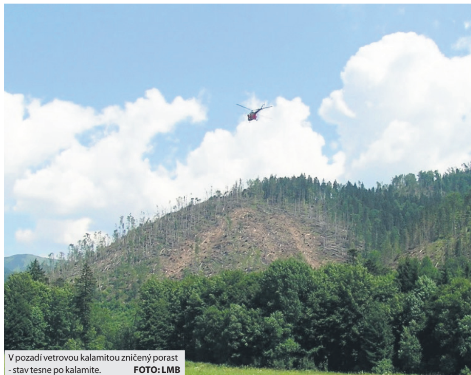
V pozadí vetrovou kalamitou zničený porast - stav tesne po kalamite.

Dnes, sedemnást' rokov po tejto katastrofickú udalosť, možno pozorovať správnosť a opodstatnenosť aktívneho prístupu pri riešení kalamitnej situácie v mestských lesoch. Na kalamitných plochách sa nachádzajú mladé