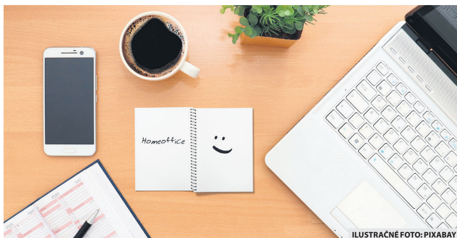
ILUSTRÁČNÉ FOTO: PIXABAY