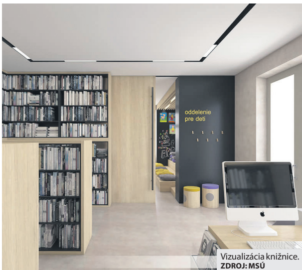
Vizualizácia knižnice.

Aj keď sa výška dotácie v porovnaní s predchádzajúcim rokom nezmenila, stále dokáže pokryť všetky náklady spojené s poskytovaním