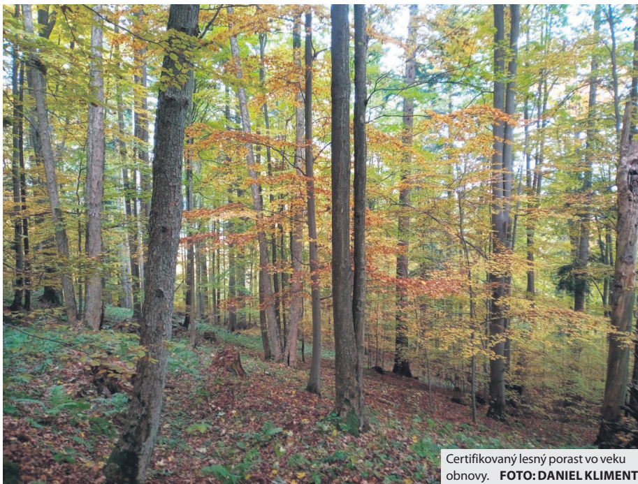
Certifikovaný lesný porast vo veku obnovy.

Audit v Lesoch mesta Brezno (LMB) bol naplánovaný do dvoch pracovných dní. Prvý deň možno označiť ako kancelársky, počas ktorého sa kontroloval celý rad dokumentov, výpisov z lesnej hospodárskej evidencie, programu starostlivosti o les, projektov ťažbovej, pestovnej činnosti a ochrany lesa, evidencií zmlúv, objednávok, súhlasov na ťažbu, odvozu dreva a mnohých iných. Druhý, tzv. terénny deň pozostával z určenia vychádzkovej trasy, na ktorej bolo možné pozorovať praktické vykonanie lesohospodárskych opatrení s dôrazom na obnovu lesa v zákonnom termíne (umelá a prirodzená obnova) podľa modelov hospodárenia, vý-