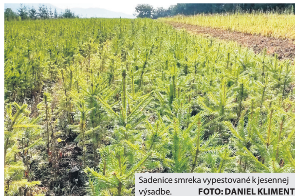
Sadenice smreka vypestované k jesennej výsadbe.

dobie tzv. výžinov buriny okolo sadeníc nahradí súbor opatrení ochrany mladých lesných porastov proti škodlivému pôsobeniu zveri. „Ten môže byť dvojaký: odhryz terminálnych púčikov alebo obhryz kôry stromov, v oboch prípadoch počas zimného obdobia. Táto činnosť sa vykonáva náterom repelentným prípravkom, prípadne mechanickou ochranou kmeňov vetvami alebo polynetom. Tento rok plánujeme takto ochrániť približne 300 hektárov mla-