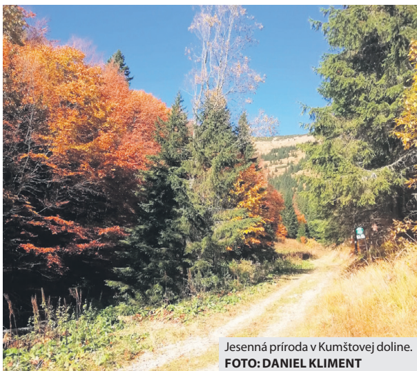
Jesenná príroda v Kumštovej doline.