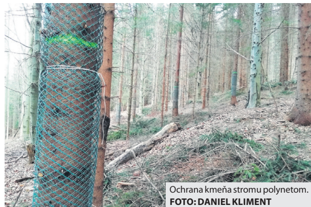
Ochrana kmeňa stromu polynetom.