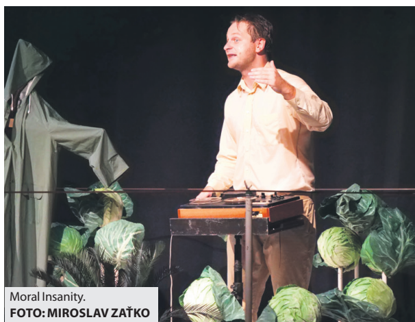
Moral Insanity.