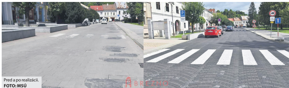
Pred a po realizácii.