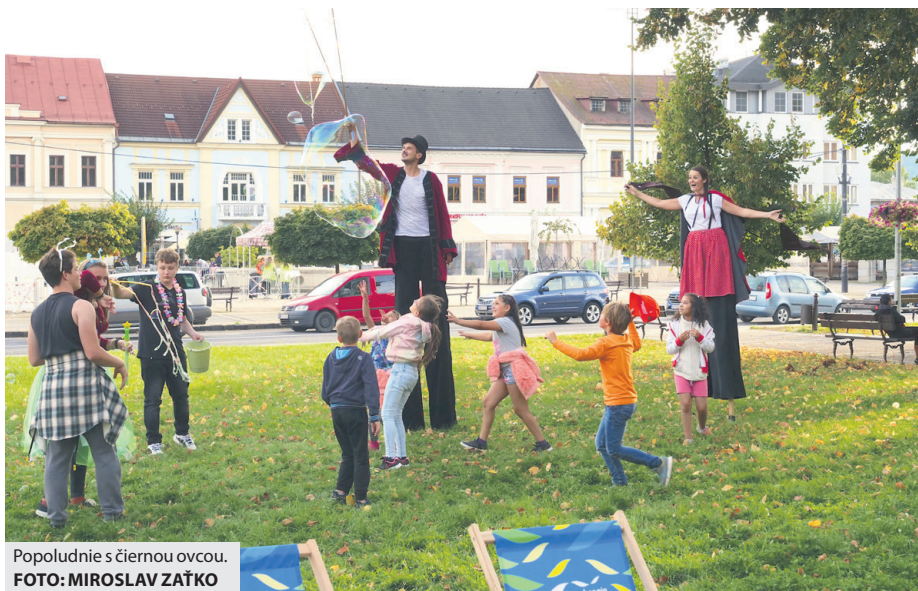
Popoludnie s čiernou ovcou.