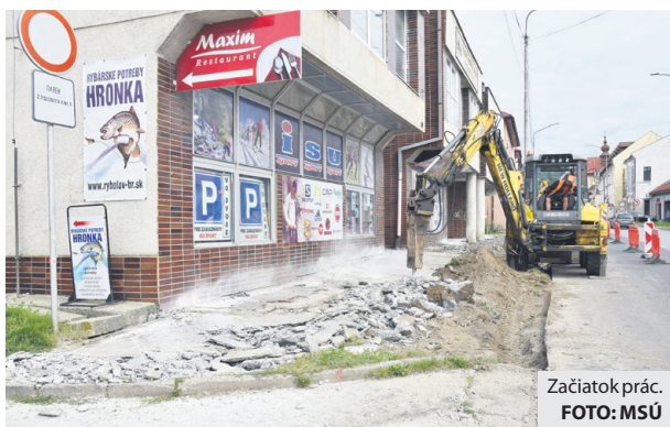
Začiatok prác.

kovacích miest, doplneniu jestvujúcich priechodov pre chodcov o zvislé dopravné značenie a osvetlenie a pôvodnú zeleň nahradí nová vhodná vegetácia. Zhotoviteľ sa pritom zaviazal, že všetky rekonštrukčné práce ukončí najneskôr do šiestich mesiacov. Aj keď predpokladaná hodnota zákazky bola stanovená na približne 600 tisíc eur, mesto ju napokon vysúťažilo za necelých 432 tisíc. Celú investíciu pokryje z vlastných zdrojov. (eš)