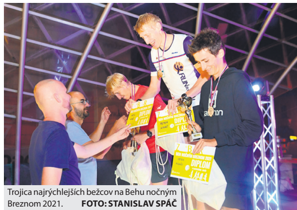
Trojica najrýchlejších bežcov na Behu nočným Breznom 2021.