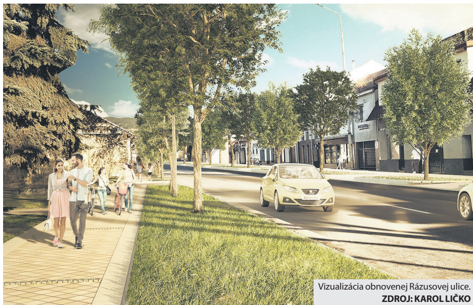
Vizualizácia obnovej Rázusovej ulice.