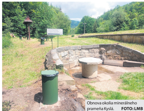
Obnova okolia minerálneho prameňa Kyslá.

Pre domácich, ale aj prechádzajúcich turistov v smere od Mýta pod Ďumbierom na Čertovicu sa zamestnanci LMB pustili do obnovy priestoru minerálneho prameňa Kyslá. „Natrelí sme kovové konštrukcie, vymenili dosky na lavičkách a stoloch, osadili sme nové smetné nádoby, pokosili a upravili