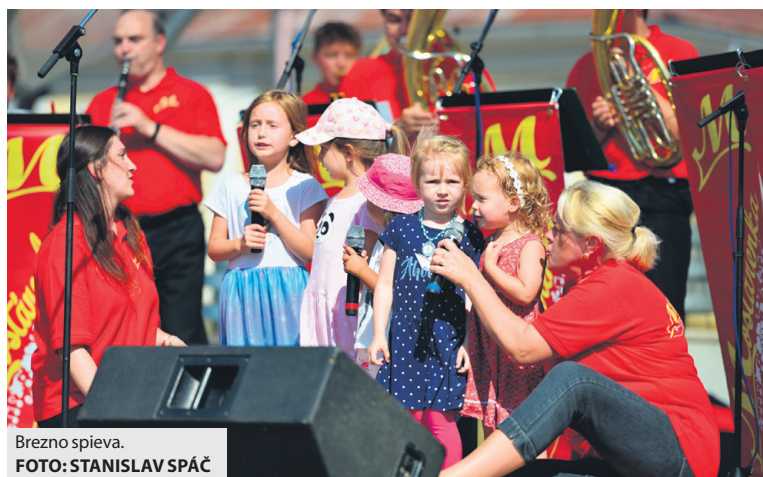
Brezno spieva.