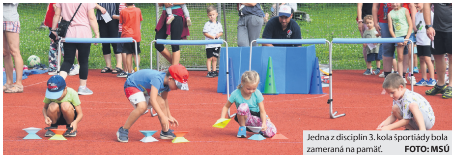
Jedna z disciplín 3. kola športíady bola zameraná na pamäť.

vnútrobloku ŠLN hostilo podujatie aj v stredu 4. augusta. Scenáristom športových disciplín boli pre tentokrát tréneri z Hokejového klubu Brezno, ktorí pre deti prichystali pestré súťaženie. Prvou disciplínou bol slalom s hokejkou, zakončený strelbou na bránku. Druhá disciplína otestovala kondíciu a koordináciu, pretože pozostávala z rôznych