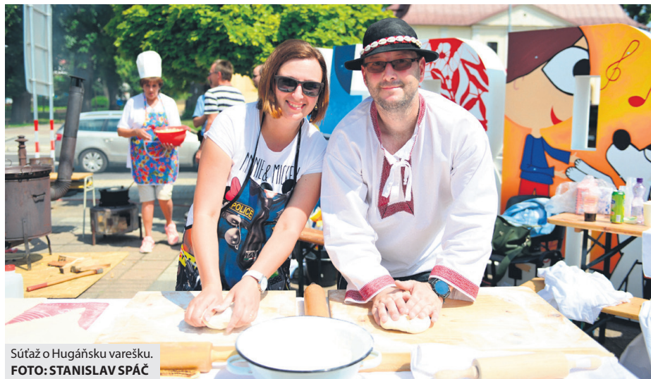
Súťaž o Hugaňsku varešku.