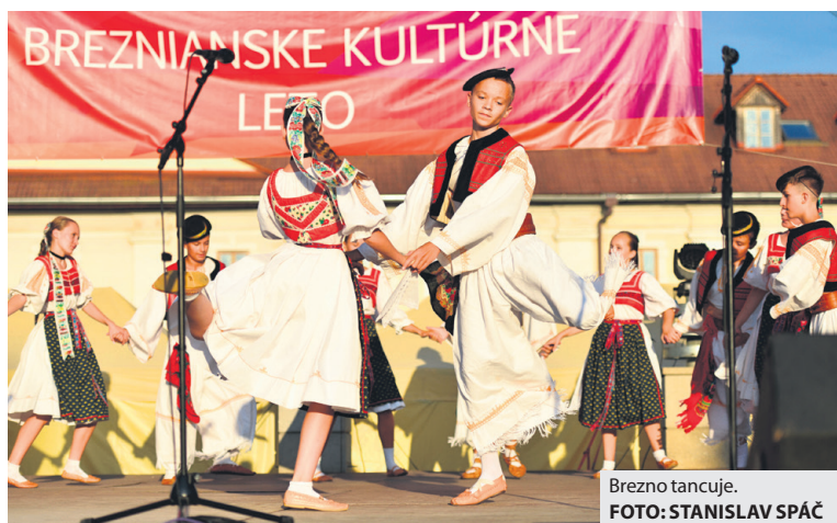
Brezno tančuje.