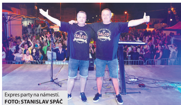
Expres party na námestí.