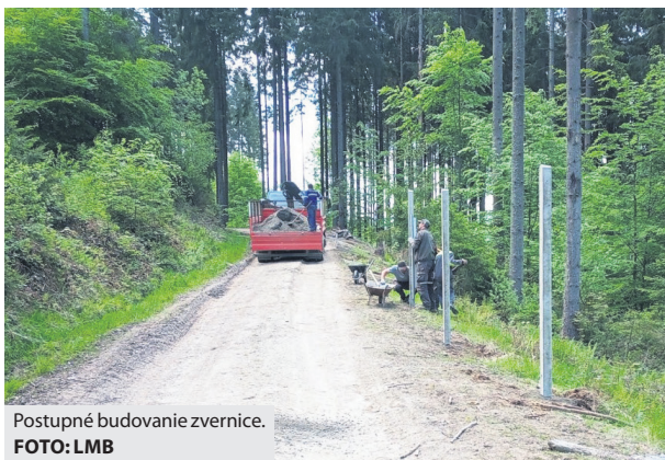
Postupné budovanie zvernice.

Niektoré cesty si však vyžadujú aj výmenu a doplnenie