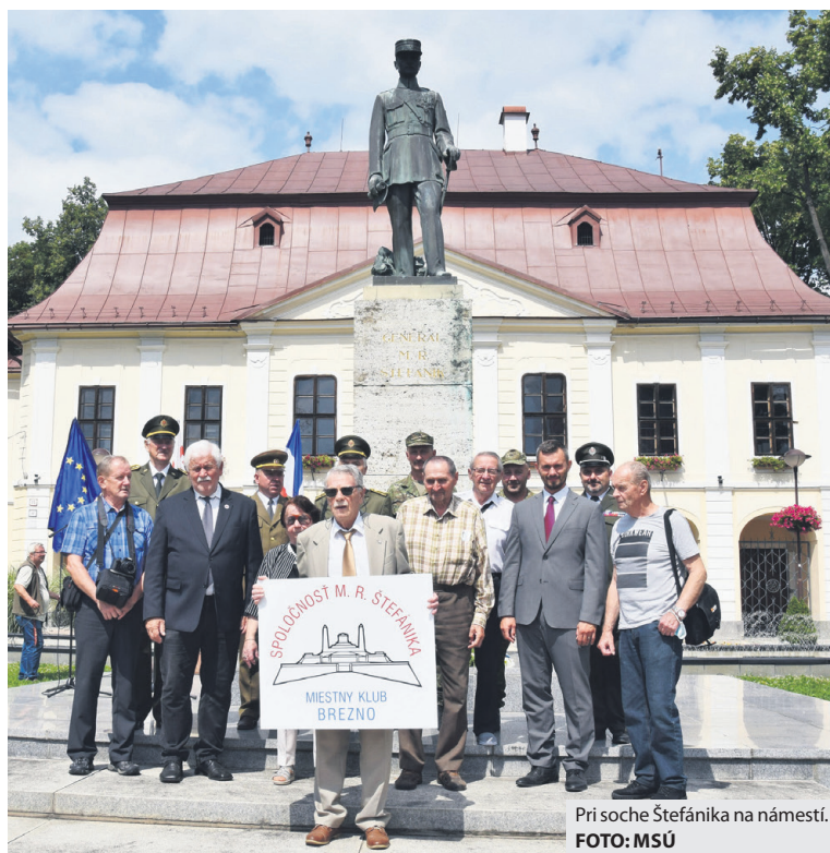
Pri soche Štefánika na námestí.

„Výnimočnosť jeho osobnosti spočíva v tom, že myšlienku zblížovania národov dokázal nastoliť a presadzovať už v čase, kedy o ňom ešte neexistovali písané dohody a pravidlá. Sám ako vojak prežil ničivý vojnový konflikt, no napriek krutosti vojny zostal Štefánik človekom a jeho ušľachtilá povaha a mravné ideály sa nezmenili,“