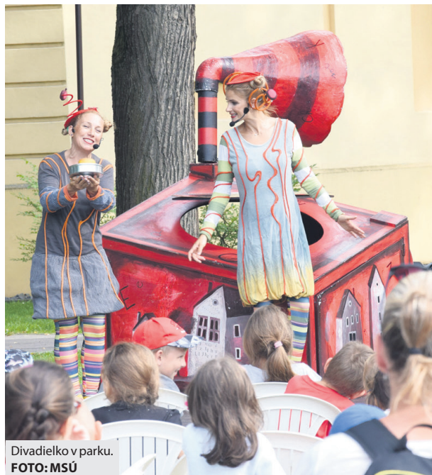
Divadelko v parku.