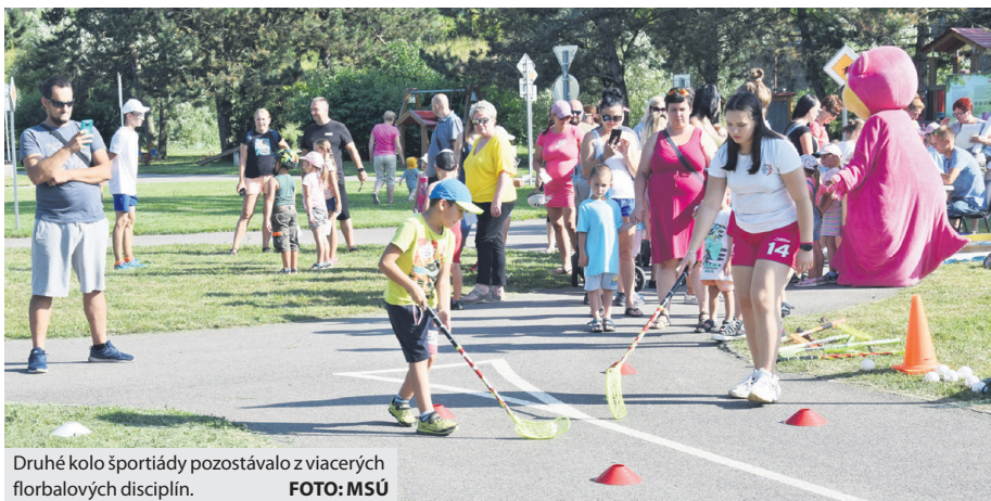
Druhé kolo športíady pozostávalo z viacerých florbalových disciplín.

vnútrobloku ŠLN hostilo podujatie aj v stredu 4. augusta. Scenáristom športových disciplín boli pre tentokrát tréneri z Hokejového klubu Brezno, ktorí pre deti prichystali pestré súťaženie. Prvou disciplínou bol slalom s hokejkou, zakončený strelbou na bránku. Druhá disciplína otestovala kondíciu a koordináciu, pretože pozostávala z rôznych