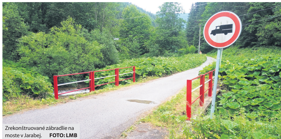
Zrekonštruované zábradlie na moste v Jarabej.