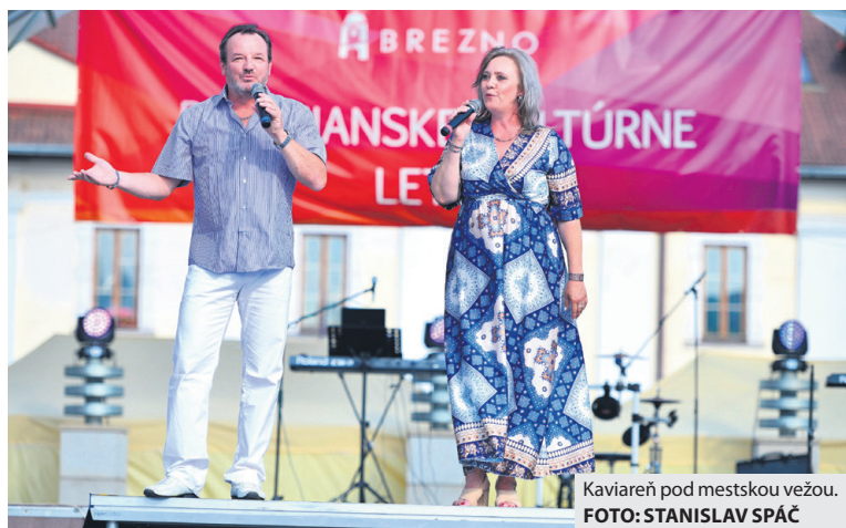
Kaviareň pod mestskou vežou.