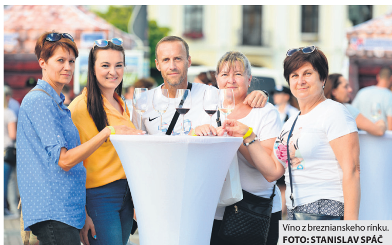
Víno z breznianskeho rínku.