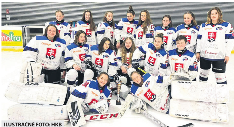
ILUSTRÁČNÉ FOTO: HKB