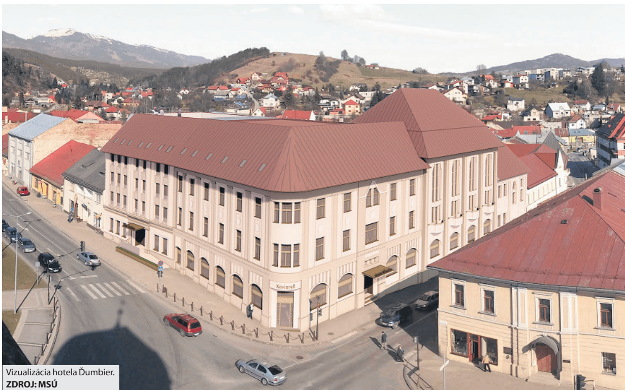
Vizualizácia hotela Ďumbier.

Mesto ako vlastníka a budúci prevádzkovateľ hotela Ďumbier v centre Brezna sa rozhodlo investovať do jeho obnovy. Historická budova by mala nadobudnúť podobu moderného mestského hotela spĺňajúceho trojhviezdičkové kritériá. Radnica už vla-