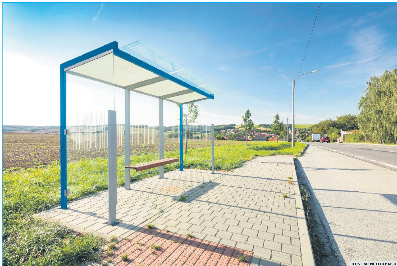
ILUSTRÁČNÉ FOTO: MSÚ