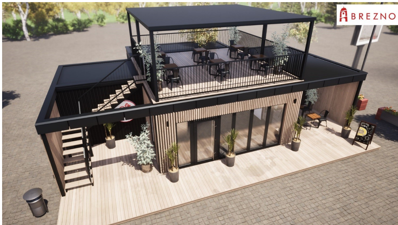
Príklad Chill zóna