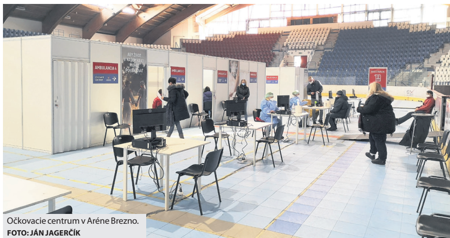
Očkovacie centrum v Aréne Brezno.