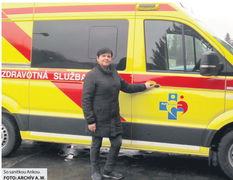
So sanitkou Ankou.

Najviac sa boríme s tým, že pacienti zneužívajú záchraný zdravotný systém a nahlásia na operačné stredisko nepravdivé údaje o zdravotnom stave. Až po príchode zistí-