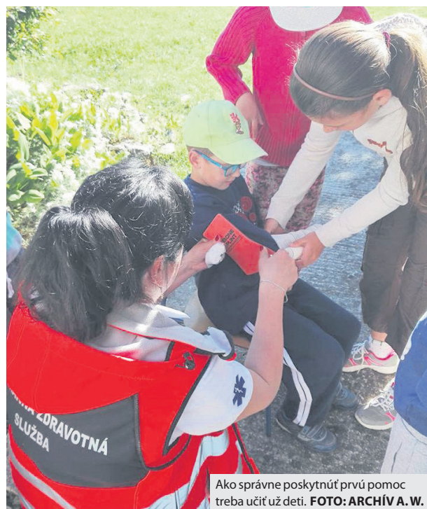
Ako správne poskytnúť prvú pomoc treba učiť už deti.