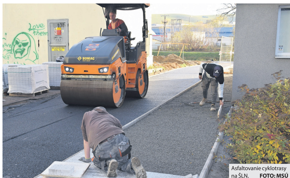
Asfaltovanie cyklotrasy na ŠLN.

odovzdali stavenisko novej cyklotrasy Brezno – Valaská vysúťažnému zhotoviteľovi. Dokončenie výstavby bolo pôvodne naplánované na február 2021, no aj vzhľadom na pretrvávajúcu koronakrízu, nevyhnutné preložky sietí či čakanie na rekonštrukciu cesty vo Valaskej, ktorá je v správe vyššieho územného celku, sa termín ukončenia stavebných prác posúva minimálne do polovice budúceho roka. Navyše v mestskej časti ŠLN sa stretol projekt cyklotrasy s projektom regenerácie vnútroblokov a keďže obe tieto investície boli naplánované a vypracované samostatne, nevyhnutne