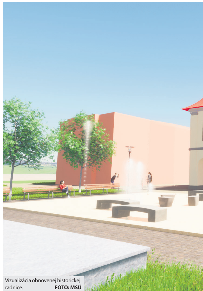
Vizualizácia obnovenej historickej radnice.

priestoroch na poschodí radnice by mali byť situované reprezentačné kancelárie vedenia mesta, zasadačka mestského zastupiteľstva a expozície múzea; časť prízemnia bude podľa architektonickej štúdie vyčlenená pre mestské informačné stredisko a sálu na komorné koncerty a výsta-