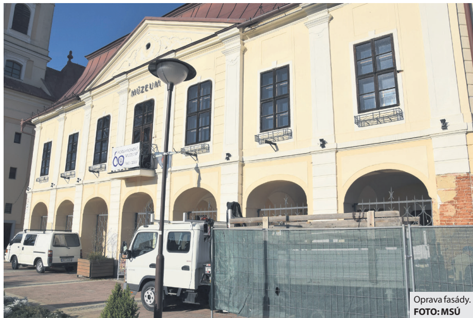
Oprava fasády.