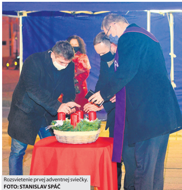
Rozsvietenie prvej adventnej sviečky.