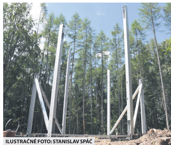
ILUSTRÁČNÉ FOTO: STANISLAV SPÁČ