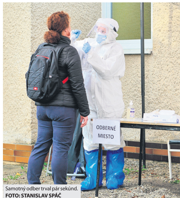
Samotný odber trval pár sekúnd.