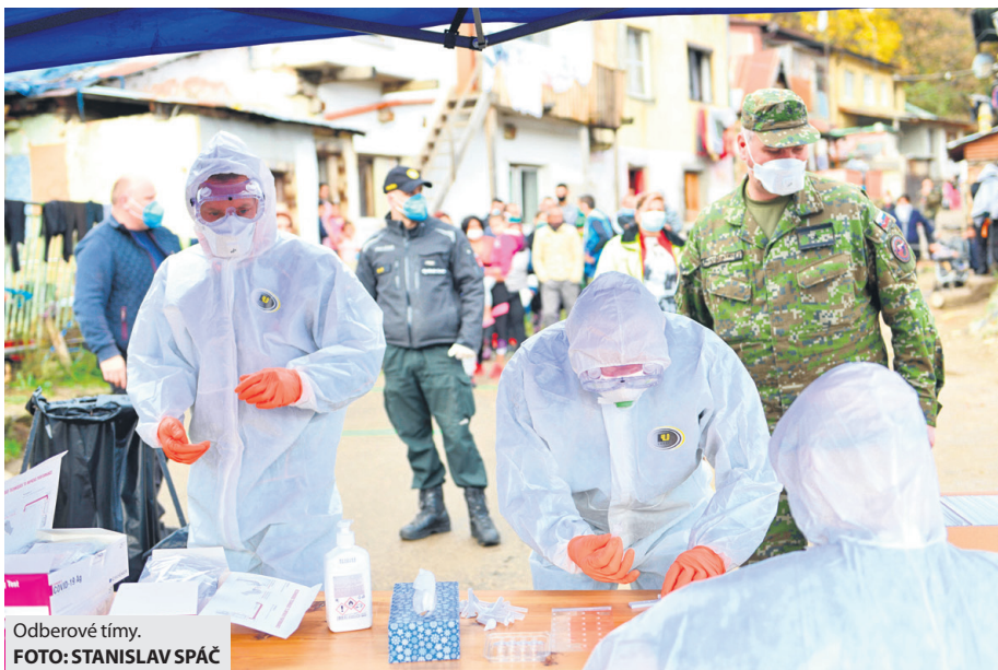
Odberové tímy.

Policajti, pracovníci mestskej polície rovnako ako aj desiatky zamestnancov mesta mali spoločný záujem, aby celoplošné testovanie bolo úspešné a prispelo k ochrane zdravia obyvateľov Brezna. Na statických odborných miestach pomáhala päť policajtov mestskej polície a den-