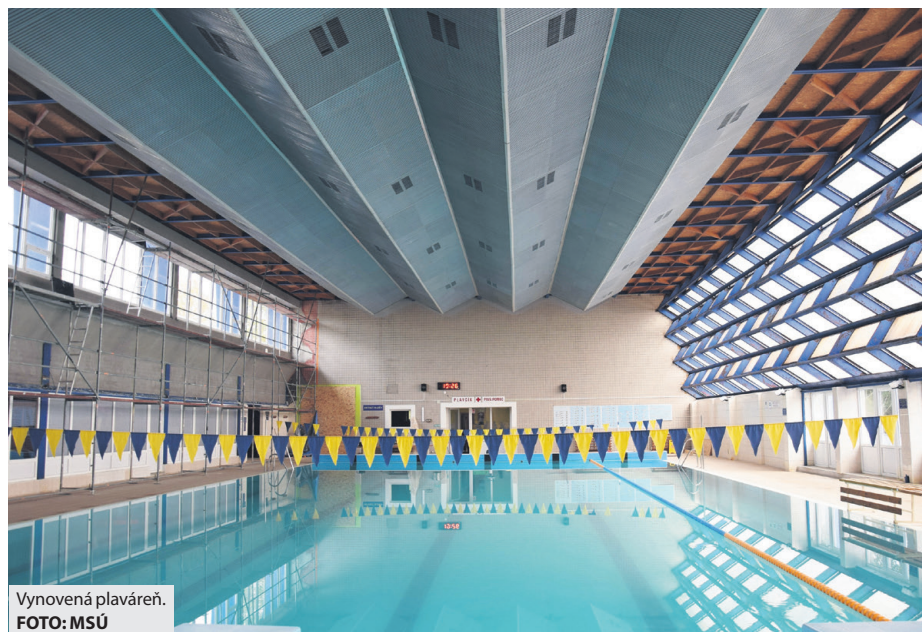
Vynovená plavárňa.

Tohtoročné prerušenie prevádzky breznianskej plavárne z dôvodu pravidelnej dezinfekcie a údržby technológií sa však vzhľadom na súčasnú epidemiologickú situáciu a prijaté opatrenia Úradu verejného zdravotníctva SR zrejme predĺži na neurčito. „V prípade možnosti otvorenia prístupíme k výmene vody v bazéne a samo-