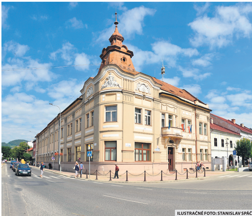
ILUSTRÁČNÉ FOTO: STANISLAV SPÁČ

Matrika vybavuje akútne prípady za prísnych opatrení