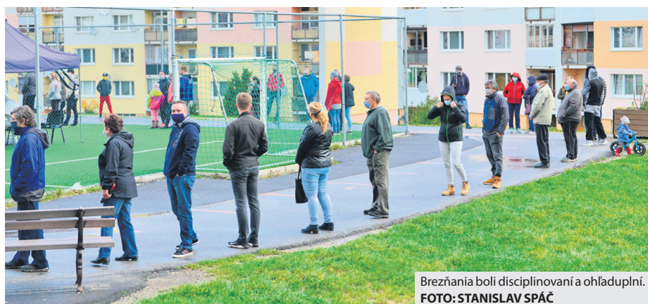
Brežňania boli disciplinovaní a ohľaduplní.