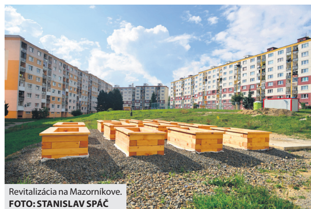
Revitalizácia na Mazorníkove.

gítinom parku pokračujú podľa harmonogramu a budú ukončené do konca tohto roka. Situácia vo vnútroblokoch na Malinovského, ŠLN a Mazorníkove je však o čosi zložitejšia. „Počas realizácie aktivít projektu došlo k niekoľkým vynúteným zmenám, ktoré nebolo možné predpo-