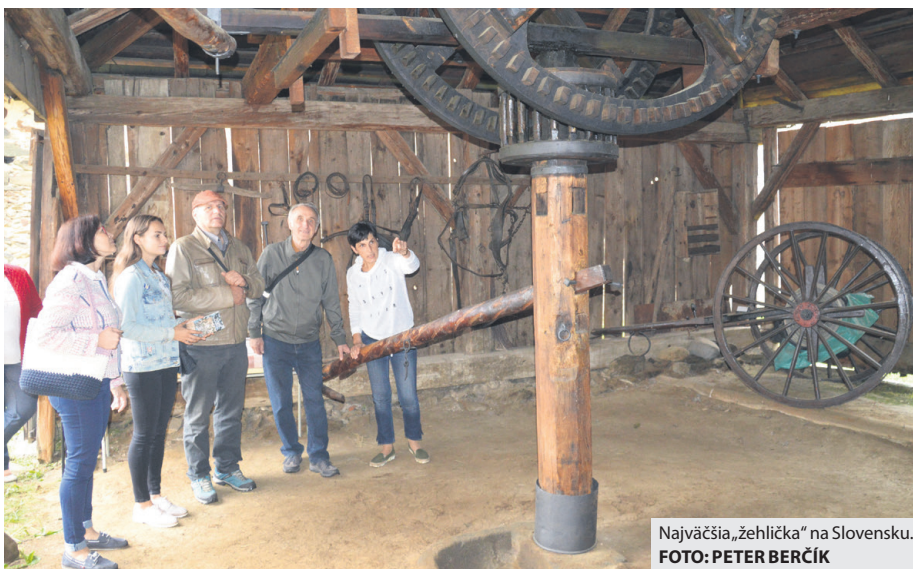
Najväčšia „žehlička“ na Slovensku.

Pri tejto príležitosti Horehronské múzeum, ktoré k to-