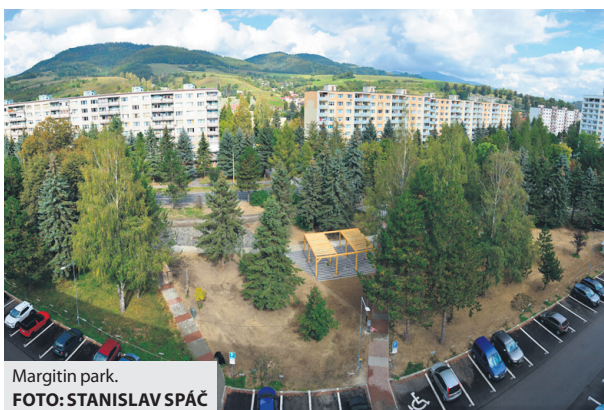
Margitín park.

Zmierniť dopady otepľovania a zlepšiť mikroklimatické podmienky na lokálnej úrovni je cieľom projektov regenerácie sídliskových vnútroblokov na území Brezna. Peniaze, ktoré radnica získala na tento účel z eurofondov, majú byť použité na adaptáciu mestského prostredia na zmenu klímy a to prostredníctvom výsadby zelene, budovaním promenád, dažďových a komunitných záhrad s dôrazom na zadržiavanie vody v území. V Brezne sú aktuálne rozpracované štyri takéto projekty, no obyvateľom dotknutých