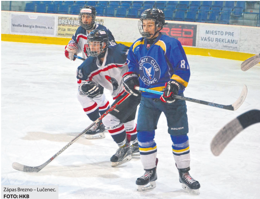
Zápas Brezno - Lučenec.